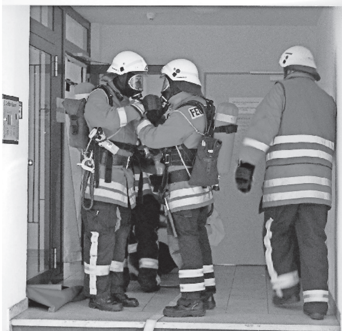
Die Feuerwehrmänner rüsten sich aus und schließen den Atemschutz an bevor sie die Rauchgrenze überschreiten.

Wir danken den Bewohnern und der Heimleitung der Thomas-Morus-Burse, dass sie uns die Gelegenheit gegeben hat, durch dieses Training unseren Ausbildungsstand zu festigen.