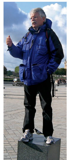
Der Vorsitzende bei einer Jugendtour des SVH in Paris