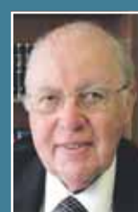
Im Alter von 84 Jahren stirbt Rudolf Schieler , der frühere Freiburger SPD-Stadtrat, Landtagsabgeordnete, Justizminister und Abgeordnete im europäischen Parlament.