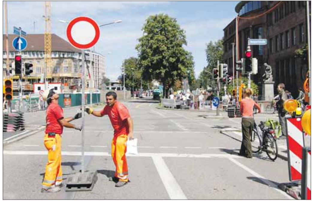
Für immer dicht: Der Rotteckring wird für den Durchgangsverkehr geschlossen. Damit ist der entscheidende Schritte hin zu einer neuen Mitte Freiburgs vor dem Theater getan. (A. J. Schmidt)