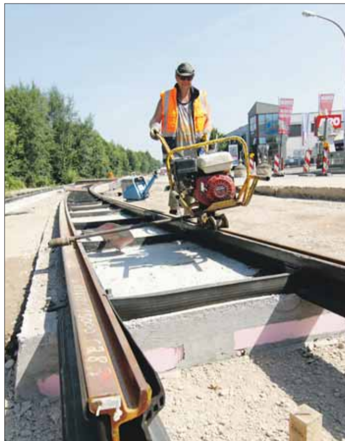
Millionenschweres Ausbauprogramm: Bis 2018 will die Stadt die Stadtbahnlinien zur Messe und durch den Rotteckring bauen. Fertig ist bis dahin auch die Linie nach Gundelfingen (Bild). Mit Streckensanierungen werden insgesamt 224 Millionen Euro investiert. (A. J. Schmidt)

In neuem Glanz: Der Schwabentorsteig konnte für 220000 Euro saniert werden. Die 1970 erbaute Fußgängersteig aus Holz war durch Pilzbefall schwer beschädigt.