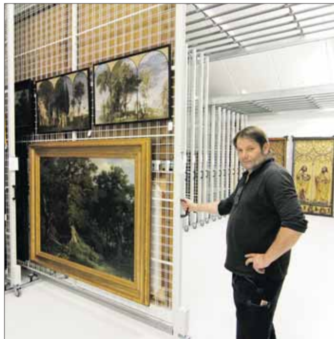
Schatztruhe im Gewerbegebiet: Alle Kunstschätze der städtischen Museen sind seit dem Sommer sicher im neuen Kunstdepot im Gewerbegebiet Hochdorf untergebracht. (A. J. Schmidt)