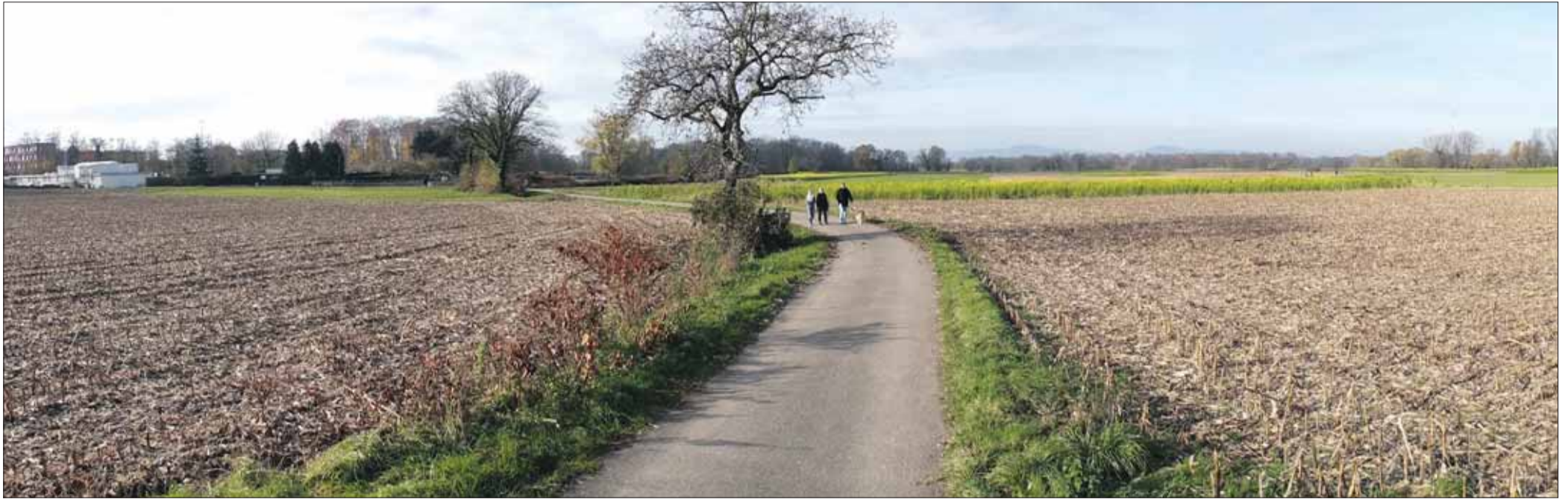
Die Stadt wächst weiter: Der Gemeinderat beauftragt die Verwaltung, Flächen in der Dietenbachniederung (Bild) und in St. Georgen-West für einen neuen Stadtteil zu untersuchen. Dort will die Stadt Wohnraum für die weiter wachsende Bevölkerung schaffen. (A. J. Schmidt)

Mehr Durchblick beim Lernen: In der Stadtbibliothek eröffnet der „Wegweiser Bildung“.