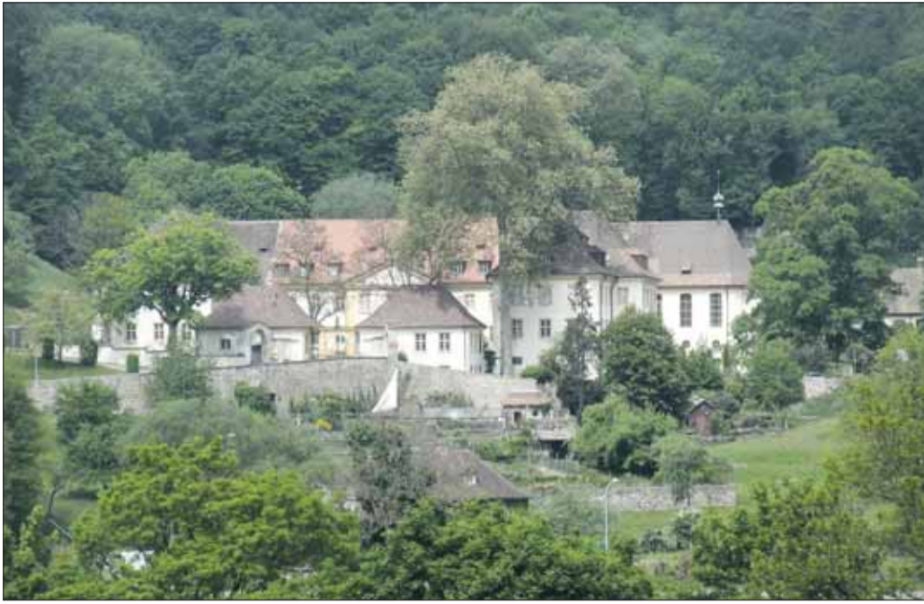
Kloster wird Schule: In der alten Kartause wird das Internationale UWC College einziehen und zusätzliche Gebäude für die Schüler und Schülerinnen errichten. (A. J. Schmidt)