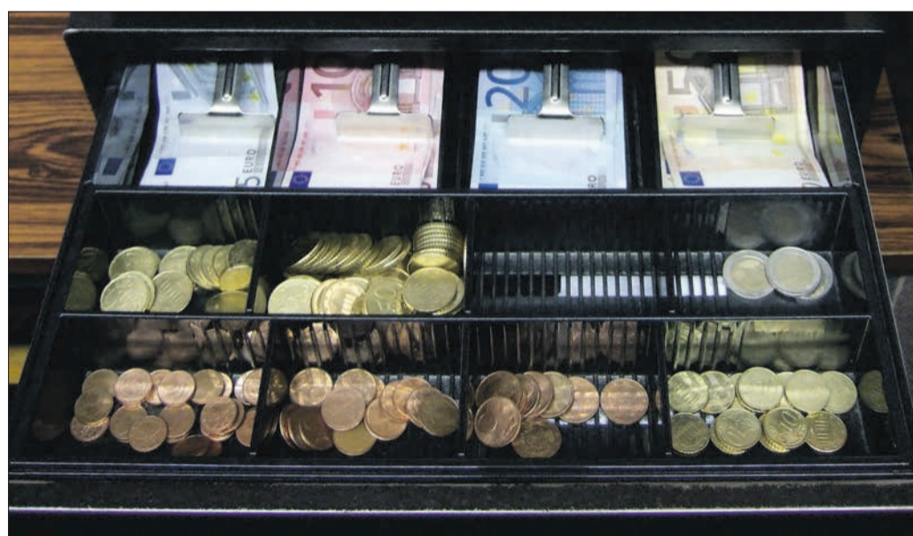
Ausgaben nicht ohne Einnahmen: Höhere Unterhaltungsmittel für Straßen und Gebäuden machen einige Fraktionen von höheren Steuereinnahmen abhängig.

Haushaltsserie (Teil XIV): Letzte Entscheidungen fallen am 2. Mai