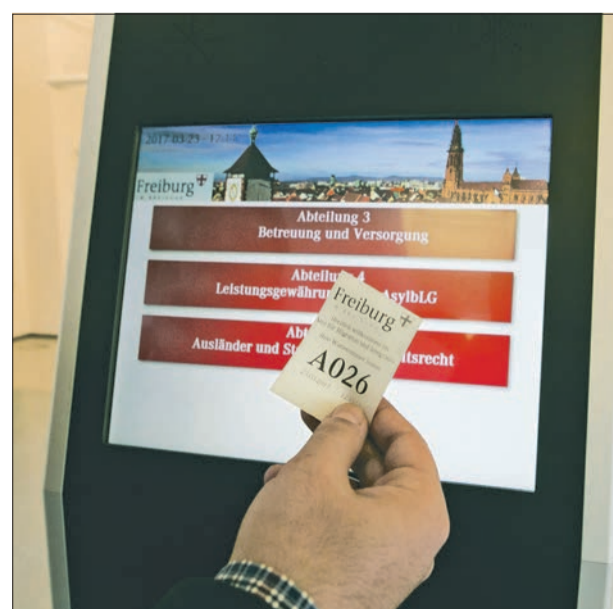
Mehr Service: Längere Öffnungszeiten sorgen für kürzere Wartezeiten.

Natürlich schaffen wir das, aber es ist Arbeit und es geht nicht schnell. Gelingende Integration ist ein längerfristiges Projekt. Und auch die Mehrheitsgesellschaft muss und wird sich dadurch ändern.