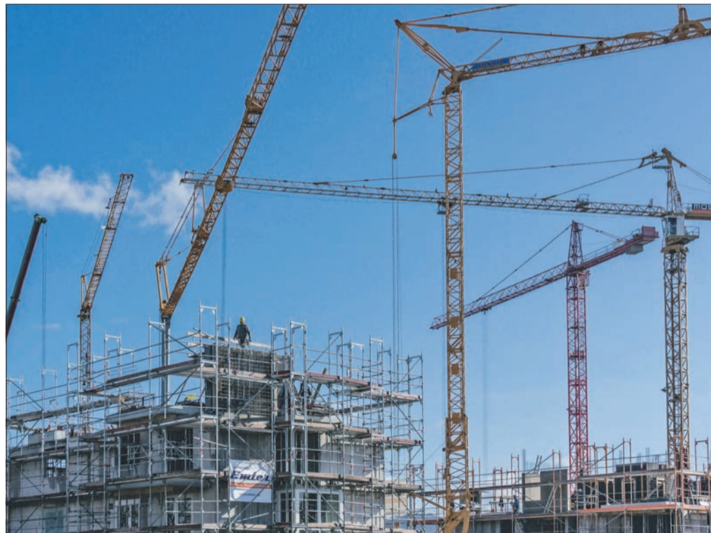
Preisanstieg ungebrochen: Obwohl in Freiburg im vergangenen Jahr über 1000 Wohnungen genehmigt wurden und sich die Baukräne fleißig drehen, wie hier im Quartier Gutleutmatten, steigen die Immobilienpreise weiterhin.

Bei genau 2845 Immobilienverkäufen wurde im letzten Jahr der höchste Gesamtumsatz seit Beginn der Aufzeichnungen 1971 erreicht: Er betrug stolze 1,2 Milliarden Euro. Einen wesentlichen Einfluss