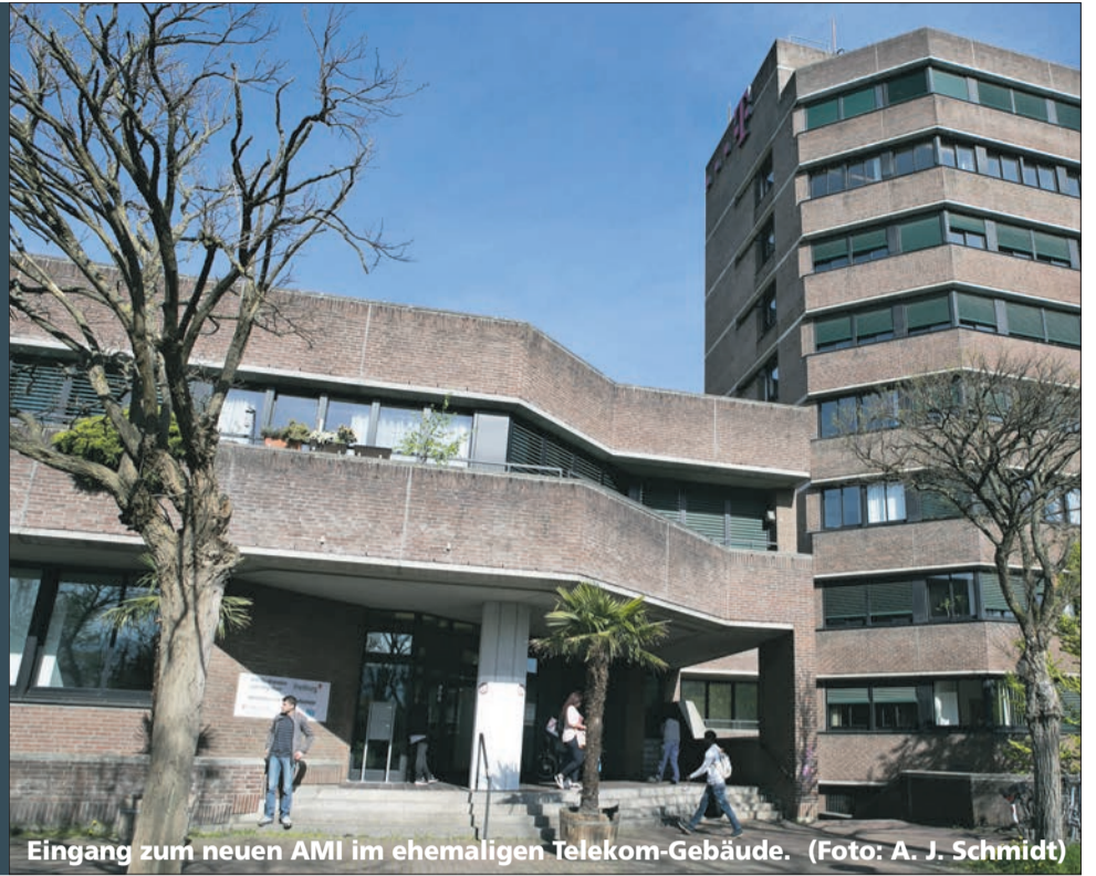
Eingang zum neuen AMI im ehemaligen Telekom-Gebäude.