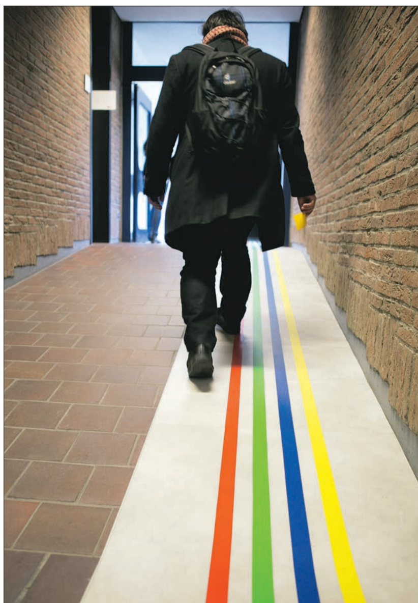
Hier geht es lang: Farbmarkierungen auf dem Boden und Laufzettel in derselben Farbe leiten die Besucher und Besucherinnen zur gesuchten Abteilung.

Gleichzeitig stellt dieser Personenkreis besonders hohe fachliche Anforderungen an die Mitarbeiterinnen und Mitarbeiter der Ausländerbehörde. Allein seit 2015 gab es acht Gesetzesänderungen mit rund 600