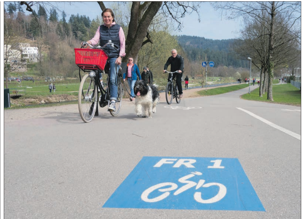
Auf den Hund gekommen: Auf den Rad-Vorrang-Routen lässt sich schnell und sicher radeln – mit etwas Übung auch mit Hund an der Leine.

Nicht zuletzt durch das Aufkommen der Elektrofahrräder haben sich die gefahrenen Geschwindigkeiten stark verändert. Vom Kleinkind, das erste Erfahrungen im Straßenverkehr sammelt, bis zum durchtrainierten Berufspendler reicht das Spektrum. Umso mehr ist es erforderlich, Rücksicht zu nehmen, Abstand zu halten, möglichst rechts zu fahren, Richtungswechsel frühzeitig anzuzeigen und generell häufiger den Blick über die eigene Schulter zu wagen,