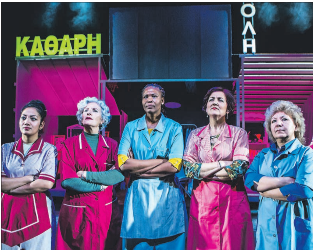
Räumen auf: Die griechischen Reinigungskräfte nehmen sich die große Politik vor.

3. Internationale Bürgerbühnenfestival, Do, 18., bis Do, 25.5., an verschiedenen Orten Weiter Infos sowie Tickets unter www.buergerbuehnen-festival.de