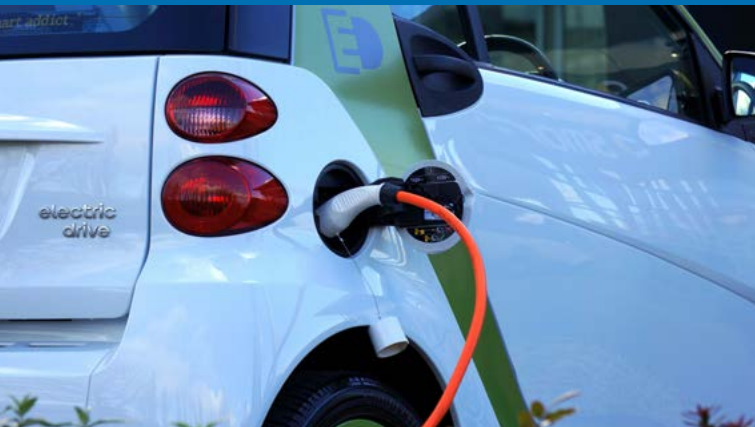
E-Fahrzeug als Speicher