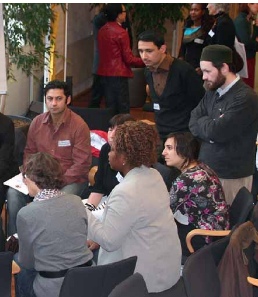
der Katholischen Akademie