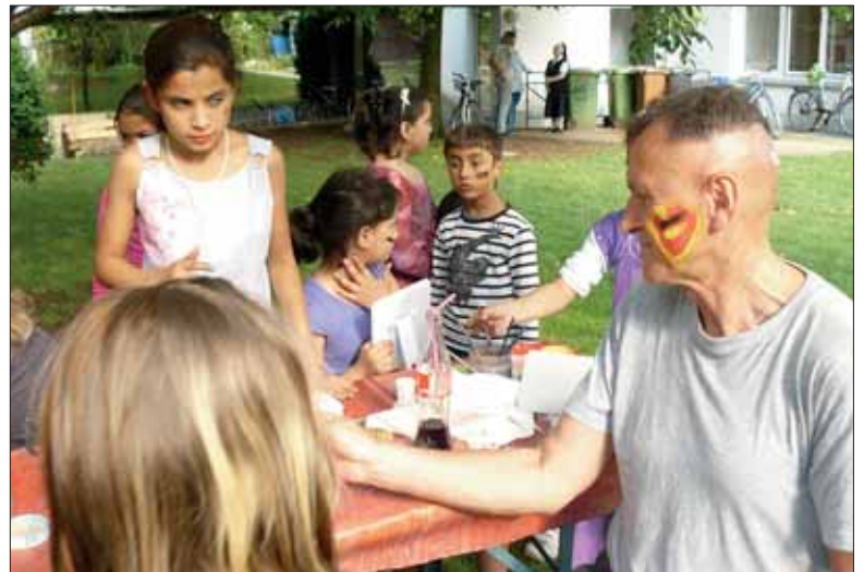
Und Deutschland als Apfel auf der Backe: Teilnehmer eines Roma-Festes in Weingarten.

Vielfalt ist für sie selbstverständlich und alltäglich. Sie kennen sich und ihr Lebensumfeld bereits so gut, dass nun eigentlich mal das Ausland dran wäre. „Ich will mal was richtig anderes machen, eine Patenschaft in Afrika zum Beispiel. Uns geht es doch total gut hier, wir haben so viel, die dort haben oft nichts“, meint