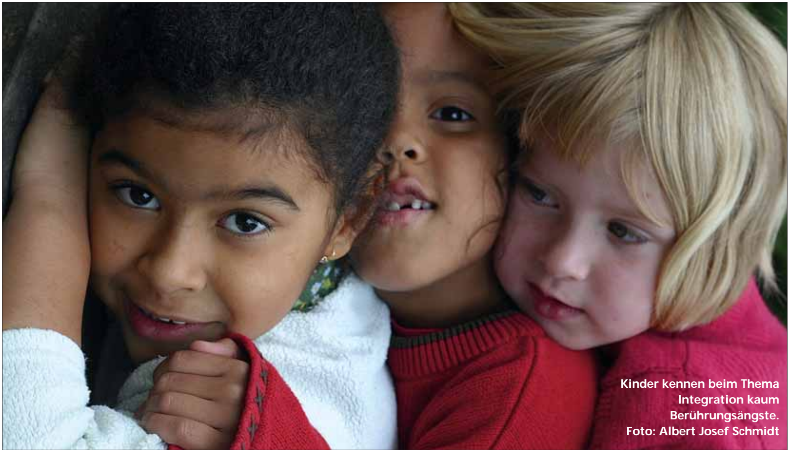
Kinder kennen beim Thema Integration kaum Berührungspunkte.