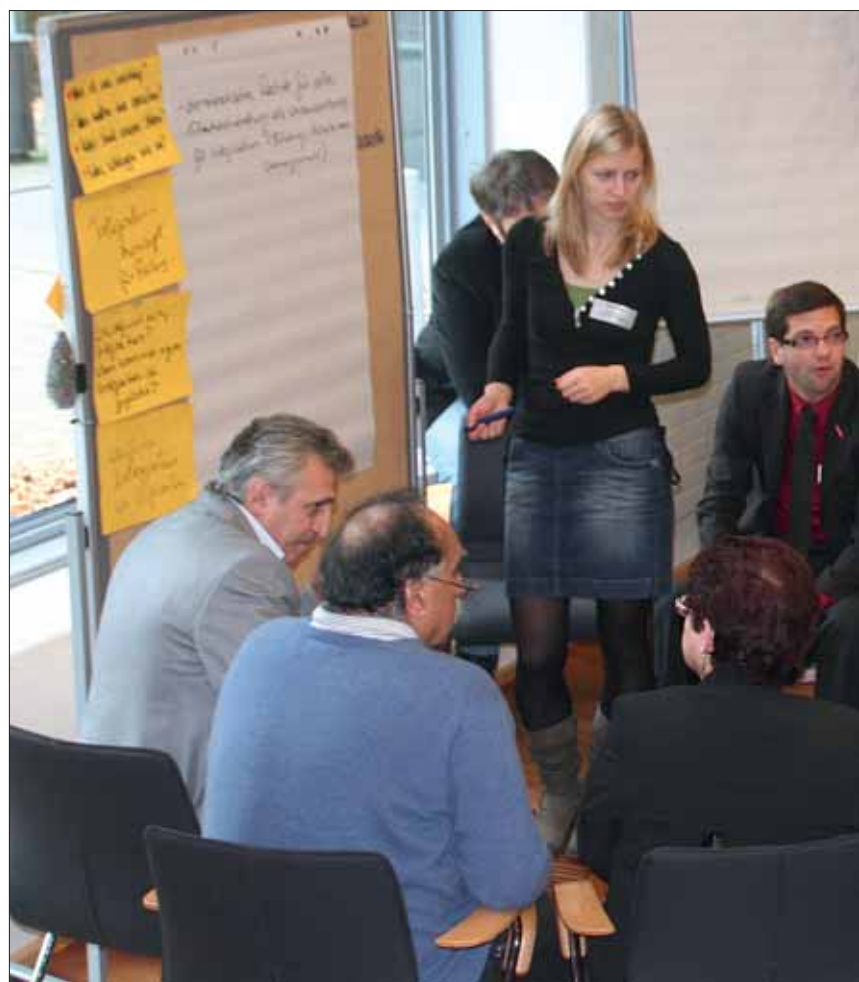
Vielfalt der Diskutanten – Vielfalt bei den Inhalten: Zukunftskonferenz in

Bei Open-Space-Veranstaltungen sind im wesentlichen nur zwei Spielregeln festgesetzt: das Gesetz der Füße und das Schmetterlingsprinzip. Das heißt, jeder begibt sich jederzeit zu jener Diskussionsrunde, die ihn aktuell am meisten interessiert – und wenn ein anderes Thema mehr Zugkraft entwickelt, flattert man ohne Abmeldung oder Umschweife mit der Leichtigkeit eines Schmetterlings dorthin. In den einzelnen Gruppen (die sich je nach Fortgang auch aufsplitten oder mit Wesensverwandten zusammentun können) wird je eine Person zum Moderieren und eine zum Schreiben bestimmt, damit aus der Flut der Ideen keine verloren geht. Und eine Ideenflut wurde es wahrhaftig, die an diesem Samstag in der Katholischen Akademie entstand. Manche Gruppen