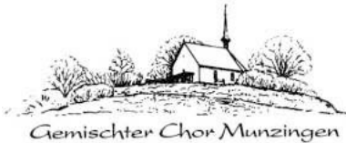
Gemischter Chor Munzingen

„Liebe Mitglieder und Freunde des Chores, liebe Bürgerinnen und Bürger Munzingens,