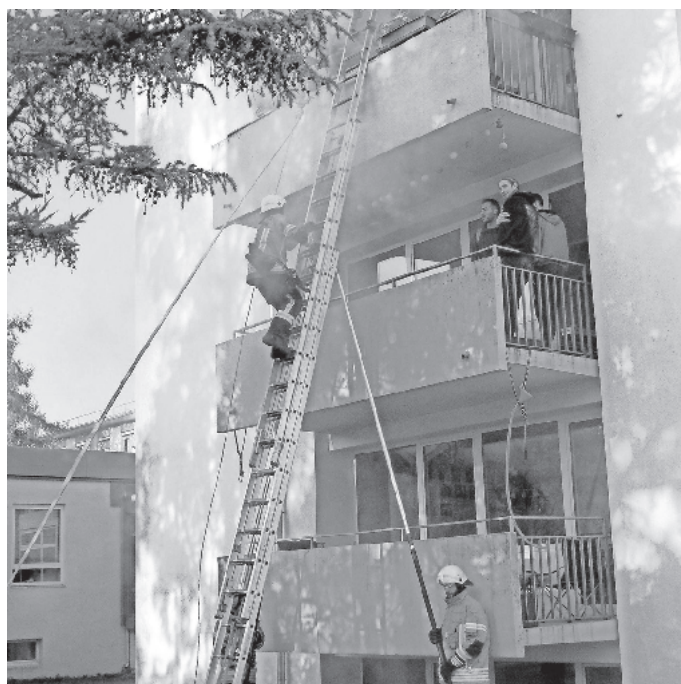
Foto: Konrad Haury, Herbstübung der Freiwilligen Feuerwehr Ebnet und Kappel

Hauptaufgabe der Abteilung Ebnet war die Menschenrettung über Leitern und das Absuchen der verqualmten Räume nach Personen die sich nicht in die Rauchfreien Bereiche retten konnten.