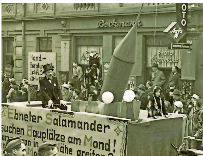
Die Ebnetter Salamander damals....