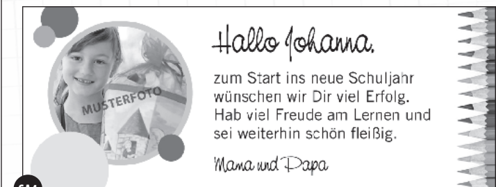
SA4 2-sp. x 35 mm | 4c: 47,49 € | sw: 17,49 € inkl. MwSt.