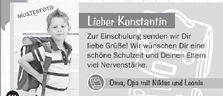
SA3 2-sp. x 40 mm | 4c: 49,99 € | sw: 19,99 € inkl. MwSt.