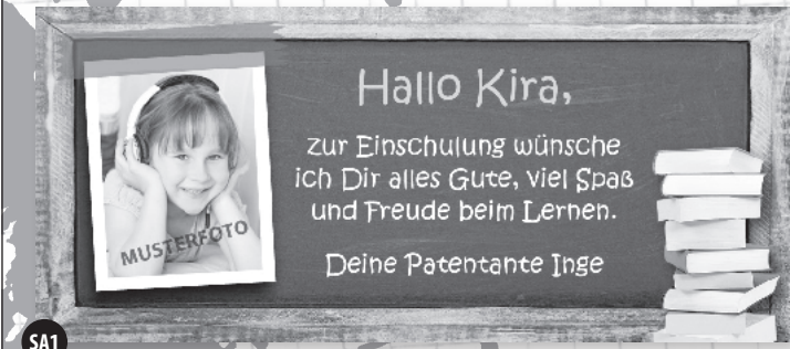
SA1 2-sp. x 40 mm | 4c: 49,99 € | sw: 19,99 € inkl. MwSt.