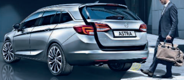
Abb. zeigt Sonderausstattungen.