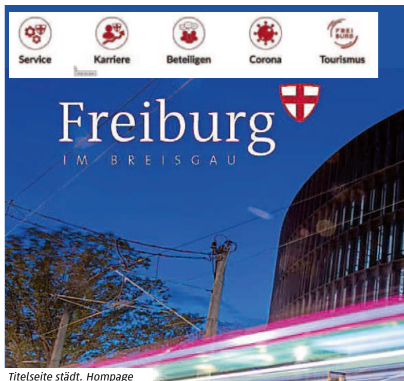
Titelseite städt. Homepage