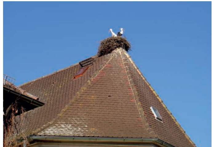
Die Störche sind da!

Nachdem die Kirchengemeinde den Innenraum des Kirchendaches bereitwillig zur Verfügung gestellt hat, konnte mit finanzieller Hilfe aus den Ortschaftsratsmitteln und einer ergänzenden Spende des Waltershofener Landfrauenvereins die Ausstiegsluke hergestellt werden, um das Nest für die Betreuung leichter zu erreichen. Spenden sind nach wie vor willkommen.