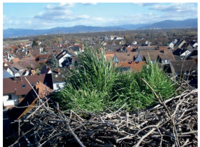
So hat's im Nest vor der Reinigung ausgesehen.