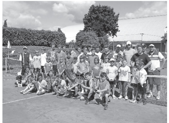
Trainer und Teilnehmer am Sommerncamp 2013

Der Abschluss wurde nach gemeinsamer Siegerehrung bei einem Grillfest mit Eltern und Freunden in geselliger Runde gefeiert.