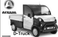
D-Truck Leichtmobile Tullastraße 6 79341 Kenzingen