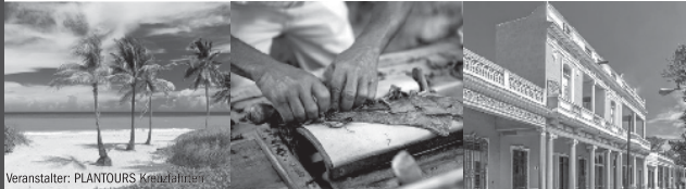
Veranstalter: PLANTOURS Kreuzfahrten

Auf dieser Reise erwartet Sie ein Highlight nach dem anderen. Erleben Sie den spannenden Mix aus mitreißender kubanischer Lebensfreude und natürlicher Vielfalt der Trauminsel Kuba. Ein Übernachtaufenthalt in Havanna darf natürlich nicht fehlen! Farbige aufgepeppt mit rostig-bunten Oldtimern brennt sich Havanna schnell in Ihr Herz. Freuen Sie sich auch auf die einzigartige, farbenfrohe Unterwasserwelt im Canareos Archipel und die malerische Kulisse Cienfuegos, die mit Recht den Namen „Perle des Südens“ trägt.