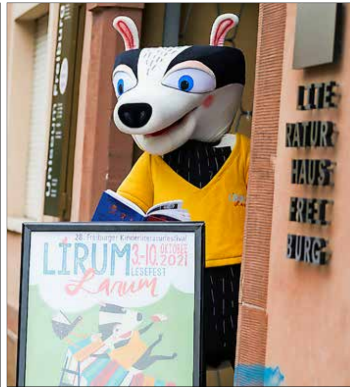
Weckt die Neugier auf Bücher: der Lesedachs des Freiburger Kinderliteraturfestivals.

Mehr kulturelle Teilhabe Das 30. Freiburger Kinderliteraturfestival findet dann vom 8. bis 15. Oktober statt: