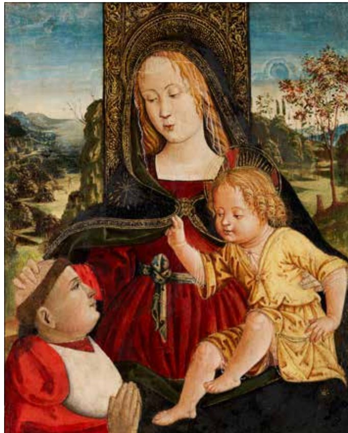
Bellissimo! Italienische Meisterwerke wie die aus dem Umfeld Pinturicchios stammende „Madonna mit Kind“ sind ab Mai 2024 im Augustinermuseum zu sehen.

Die Sanierung in Altenburg ist für Freiburg eine einzigartige Gelegenheit, Kunstwerke der Thüringer in gleich zwei hochkarätigen Ausstellungsprojekten in Freiburg zu zeigen. Das Augustinermuseum zeigt in „Bellissimo!“ italienische Meisterwerke vom Mittelalter bis zur Renaissance. Und das Museum für Neue Kunst präsentiert in Anlehnung an den gleichnamigen Spielfilm von Charlie Chaplin in „Mo-