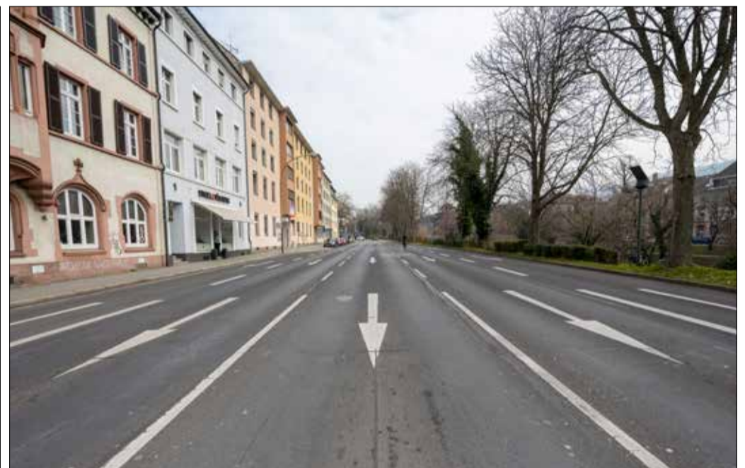
Viel Platz: Wenn der Verkehr unterirdisch im Tunnel fließt, könnte man den Raum rechts und links der Dreisam ganz anders nutzen. Eine Spur soll für den Restverkehr reichen.

Der Freiburger Gemeinderat, die Bürgervereine Mittel- und Unterwiesle und Oberwiesle-Waldsee sowie der Lokalverein Innenstadt hatten gefordert, bei den Planungen des Stadttunnels zu untersuchen, ob bei Sperrungen in einer Tunnelröhre der Verkehr über die jeweils andere Tunnelröhre geführt werden kann. Daraufhin haben das Regierungspräsidium und