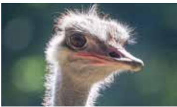
Publikumslieblich: Wer und was den Mundenhof so anziehend macht, steht auf Seite 12.

In Auszügen: Die Haushaltsreden der Fraktionen