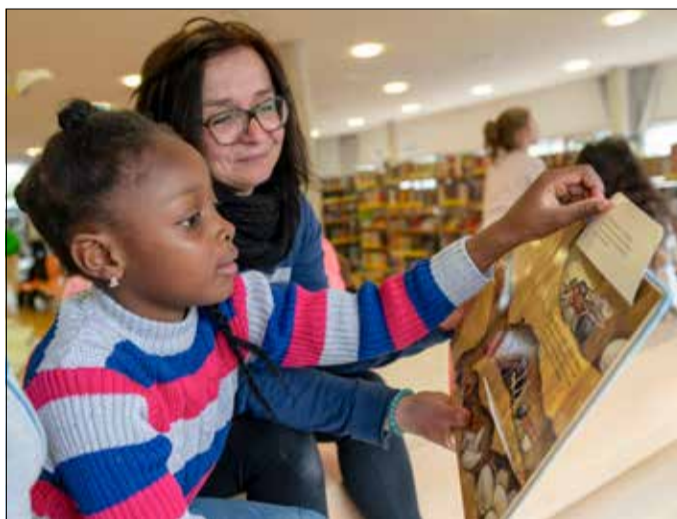
Nah dran an den Kindern: Schon die Kleinen für Literatur zu begeistern, wie hier bei der Buchwoche – das ist dem Team der Stadtbibliothek ein wichtiges Anliegen.

Mit dem Filmangebot „Filmfreund“ und den beiden Musik-Streamingdiensten „Naxos“ und „Freegal“ hat die Stadtbibliothek ihr Online-Angebot während der Coronazeit stark ausgebaut. 2022 stieg die Nutzung dieser digitalen Angebote erneut an, auf inzwischen 425 230 Zugriffe.