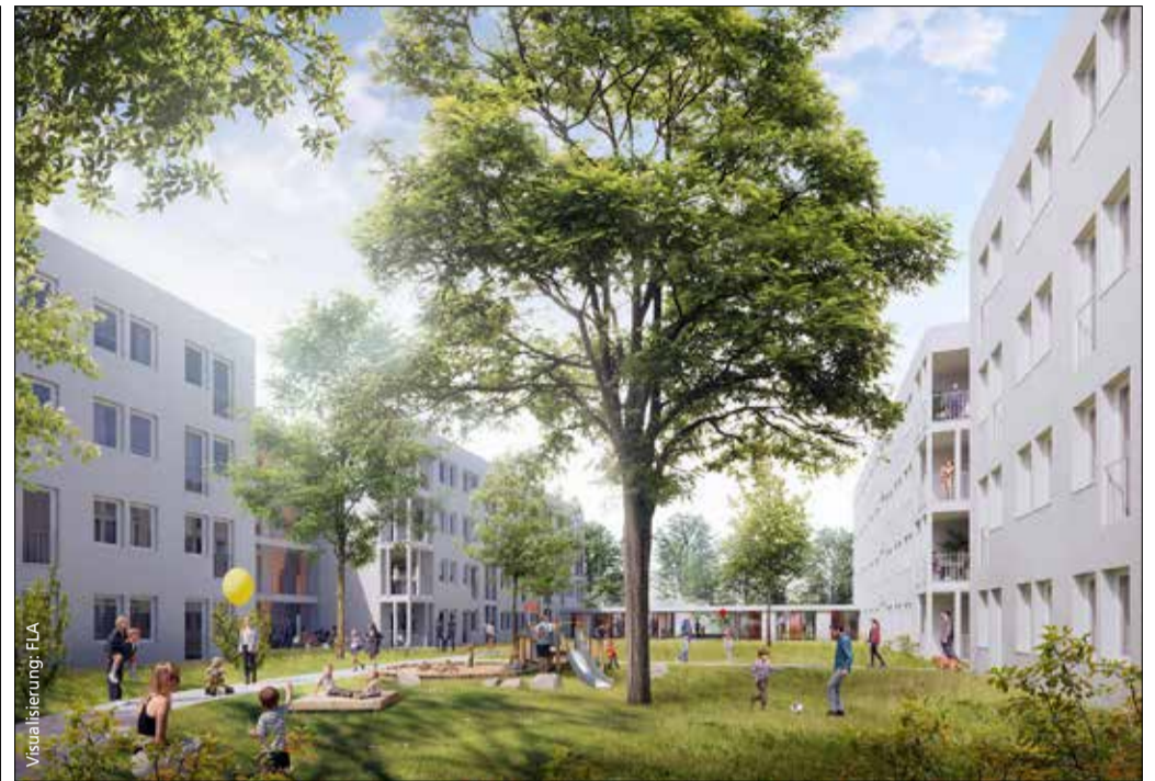
Schöner Plan: Der vorhandene Baumbestand soll so weit wie möglich erhalten bleiben.

Auf dem Grundstück befinden sich aktuell drei Zeilengebäude aus dem Jahr 1962. Die insgesamt 54 Dreizimmerwohnungen genügen in vielerlei Hinsicht nicht mehr zeitgemäßen Anforderungen. Stattdessen soll hier ein attraktives und zukunftsfähiges neues Wohnquartier mit zirka 100 Neubauwohnungen entstehen.