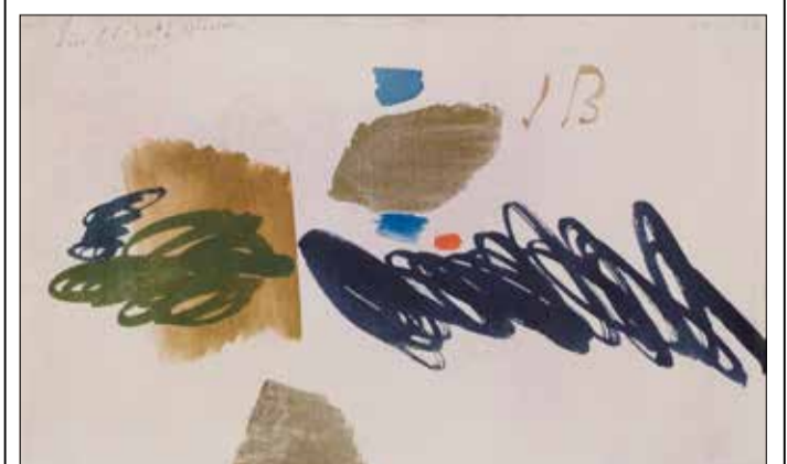
Bissiers Initialien: Im Werk „14.XI.56 / 24.XII.56“ stehen die Initialen des Künstlers als gleichberechtigtes Bildelement.

Über eine Auswahl der angekauften Arbeiten sprechen Isabel Herda und Lisa Bauer-Zhao vom Museum für Neue Kunst in einem Video: freiburg.de/bissier Infos: www.freiburg.de/museen