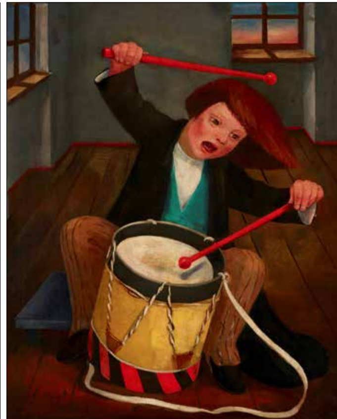
Modern Times: „Der kleine Trommler“ von Elisabeth Voigt ist eine der Leihgaben des Lindenau-Museums, die das Museum für Neue Kunst ab Herbst 2024 zeigt.

„Modern Times“ präsentiert ab Herbst 2024 im Museum für Neue Kunst Werke vom Expressionismus bis zur Neuen Sachlichkeit aus dem Lindenau-Museum, ergänzt um Arbeiten aus dem eigenen Bestand. Künstlerinnen und Künstler wie Otto Dix, Conrad Felixmüller, George Grosz, Käthe Kollwitz oder Hanna Nagel spiegeln in ihren Arbeiten das Leben zwischen den beiden Weltkriegen: vor allem mit dem Blick auf jene Menschen, die gesellschaftlich ganz unten standen. Kriegserfahrung und Traumata, Armut