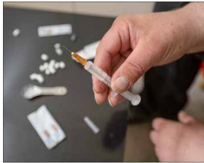
Raus aus der Schmutzdecke: Geplant sind sieben Drogenkonsumplätze – sauber und medizinisch überwacht.

Zwar gibt es in Freiburg seit 2002 einen Kontaktladen, in dem sich Drogenabhängige treffen können, konsumieren dürfen sie dort aber bislang nicht. Das soll sich jetzt ändern: Im Juni 2022 beschloss die Landesregierung, Drogenkonsumräume auch in Städten mit weniger als 300 000 Einwohnern zuzulassen.