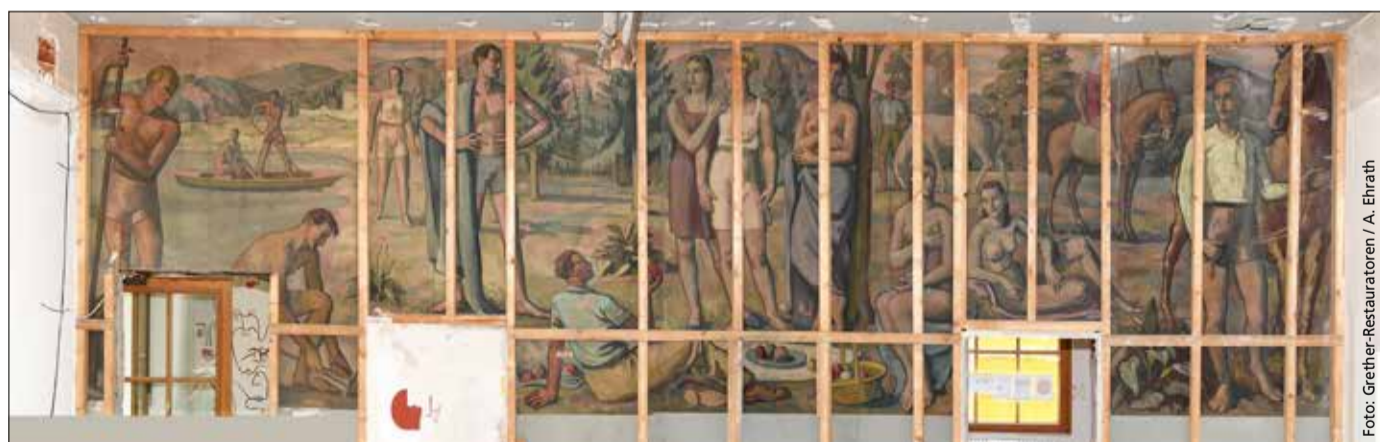
Unerwarteter Zeitzeuge: Das Gemälde von Theodor Kammerer im ehemaligen Verkehrsamt tauchte bei den Umbauarbeiten auf.

Nach der Freilegung, Untersuchung und Sicherung des Bildes durch eine Restauratorin fand eine Begutachtung durch das Landesamt für Denkmalpflege statt. Hieraus resultierte die Forderung des