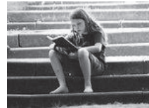
Romane zum Lesen