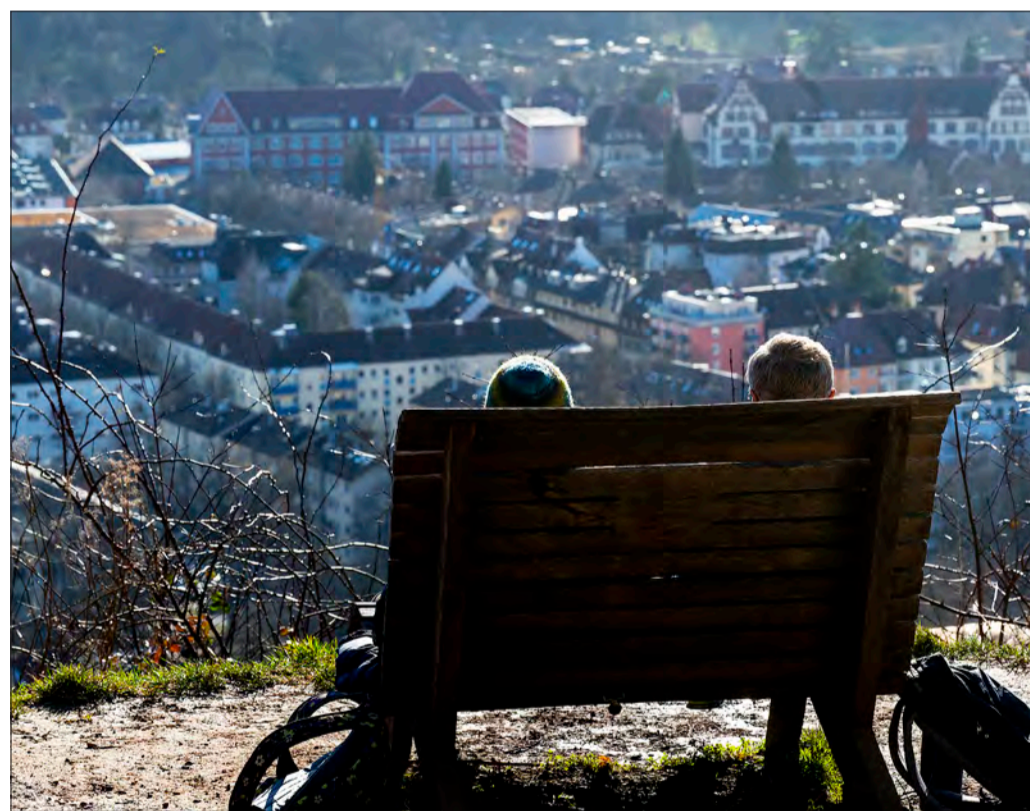
Schön hier: Die Wiehre ist auch aus dieser Perspektive ein besonders attraktiver Stadtteil.

Freiburg ist überwiegend eine Stadt der kurzen Wege. Am besten bewerten die Befragten die Erreichbarkeit der Innenstadt, die Lage zur Arbeitsstätte und die Versorgung mit dem ÖPNV, insbesondere in den zentral gelegenen Stadtbezirken. Als einziges Thema