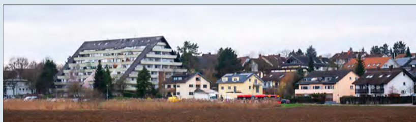
Einzigartig: eines von drei Hügelhäusern, die das Tiengener Ortsbild prägen.