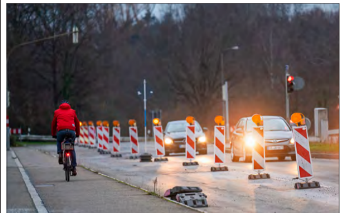
Bald Vergangenheit: Künftig müssen sich Fahrradfahrer auf der Berliner Brücke nicht mehr eine Spur auf der linken Seite teilen, sondern können auf getrennten Wegen radeln.

Nun wird ein 3,5 Meter breiter Radweg geschaffen, auf dem Radfahrende in beide Fahrrichtungen genügend Platz haben und sich wie üblich rechts voneinander begegnen. Der bisherige stadtauswärtige Radweg bleibt künftig dem Fußverkehr überlassen. Die Strecke ist Teil der künftigen Radvorrangroute FR5 vom Rieselfeld, Weingarten und dem neuen Stadtteil Dietenbach Richtung Stühlinger und Innenstadt.