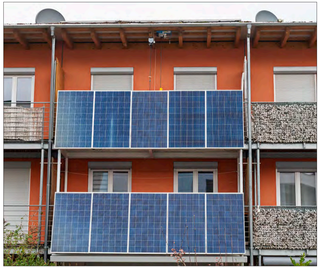
Ob Solarmodule am Balkon, eine neue Dämmung fürs Haus oder Wärmepumpen – die Palette an Fördermöglichkeiten im Programm „Klimafreundlich Wohnen“ ist breit. Seit 1. Januar hat sich einiges verändert. Was wie bezuschusst wird, darüber klären Energieberater auf.

Beim Baustein „Stromerzeugung erneuerbar“ werden Wärmepumpen, Biomasseanlagen, gegebenenfalls in Kombination mit Solarthermieanlagen, sowie Wärmenetze gefördert. Nicht mehr gefördert werden Heizungsanlagen mit fossilen Brennstoffen. Neu ist außerdem, dass es Förder-