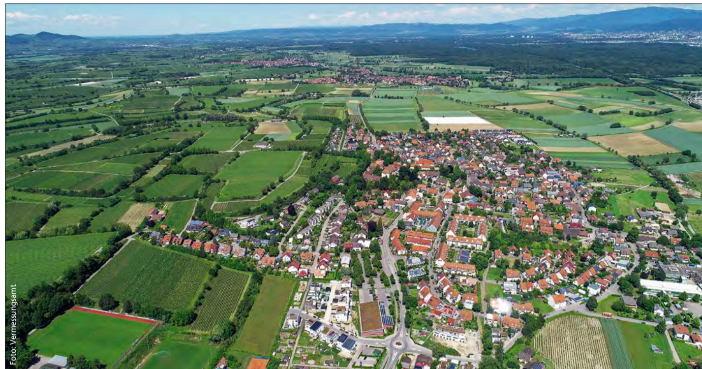
Wie auf einer Perlschnur reihen sich die vier Tunibergortschaften aneinander. Im Vordergrund ist Munzingen zu sehen, dahinter Tiengen und Opfingen. Weit links am Horizont erkennen Leserinnen und Leser mit Adleraugen sogar Waltershofen.

Bürgerbeteiligung zur Rahmenplanung erfolgreich abgeschlossen