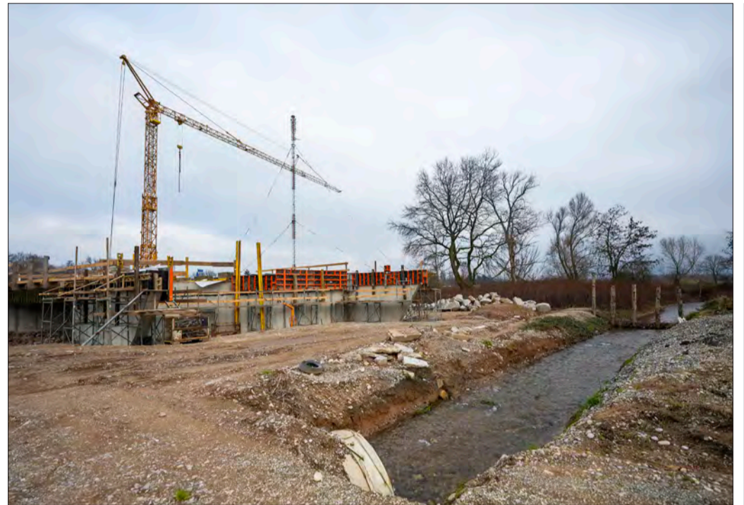
Es geht voran: Über Dietenbach dreht sich schon der erste Kran – für den Gewässerumbau. Das Brückenbauwerk gibt eine Ahnung, wie weit das Gelände aufgeschüttet wird.