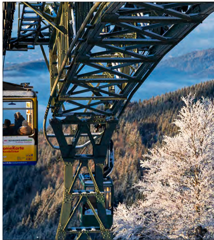
Beliebt wie eh und je: Die Schauinslandbahn freut sich nach zwei Coronajahren über gestiegene Fahrgastzahlen.