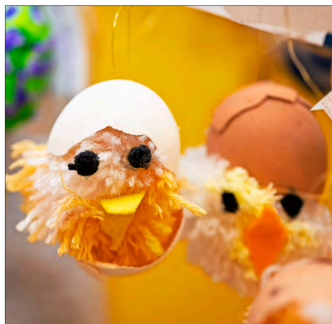
Liebevoll gestaltet: ein Küken-Kunstwerk aus dem Jahr 2022

Eine Museums-Jury prämiert die kreativsten Arbeiten. Die Gewinne werden separat für Grundschulen und Kindergärten vergeben. Der erste