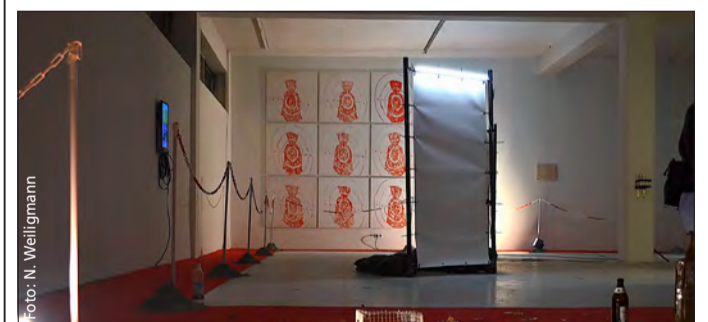
„Ideal versus Business: das Thema der neuen Ausstellung im L6

Eine kritische Haltung gegenüber Kunstmarkt und Institutionen scheint obligatorisch für junge Kunstschaffende. Jedoch wird die rebellische Attitüde oft durch gerade jene Mechanismen des Kunstbetriebs, die sie kritisieren, vermarktet und verwässert.