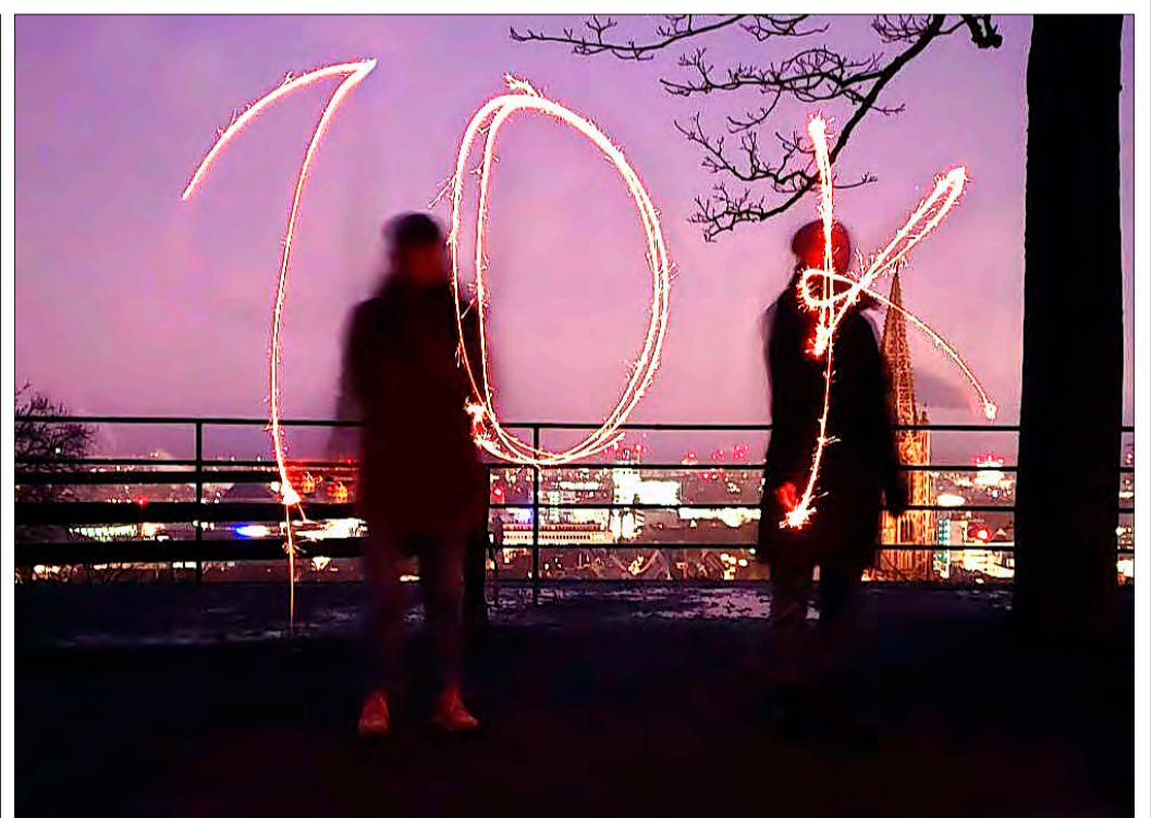
Grund zur Freude: Die städtischen Online-Redakteurinnen und -Redakteure freuen sich mit einem Lichtbild mit Blick auf die Stadt über die geknackte 10000-Follower-Marke.

Auf Instagram ist Freiburg seit April 2021 aktiv und konnte hier in vergleichsweise kurzer Zeit viele Fans gewinnen. Auch auf dem noch jungen Medium Mastodon sind es mittlerweile fast 1000.