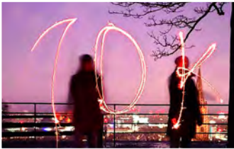
Grund zur Freude: Der Stadt folgen 10000 Menschen auf Instagram. Mehr auf Seite 9.

Viel zu zählen: Bevölkerungsrekord in Freiburg