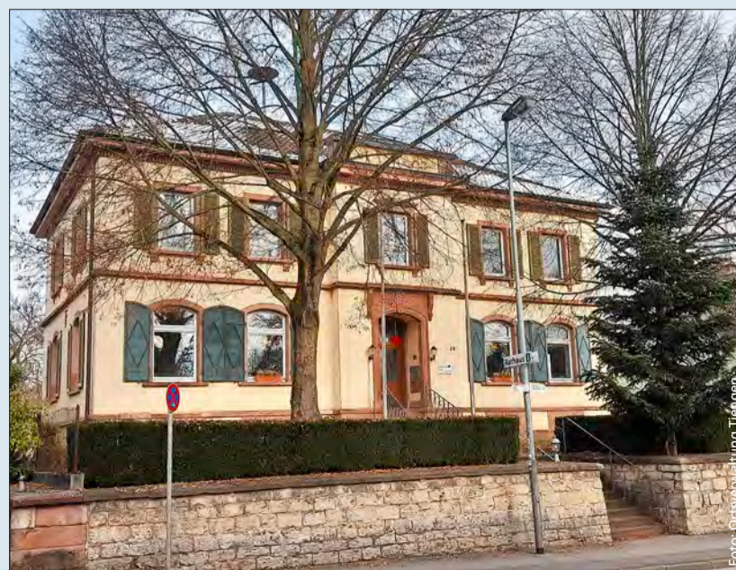
Rathaus mit Charme: In dem alten Gebäude arbeitet die Tiengener Verwaltung.

Gute Frage, in 2023 sollten die Freiburger im Juni an zwei Wochenenden unsere weiteren Veranstaltungen zum 50-jährigen Jubiläum Freiburg-Tiengen nicht versäumen. Im Juni finden außerdem das Winzerfest (17./18.6.) in den Weinbergen mit einem tollen Blick nach Osten auf den Schwarzwald und die Skyline der Stadt und das Sportfest am Reutemattensee (25.6.) statt. Ansonsten hat Tiengen bekanntermaßen musikalisch große Veranstaltungen. Der Musikverein mit mindestens zwei Konzerten und der Kulturverein mit hervorragenden Veranstaltungen in unserem Tuniberghaus. Des Weiteren das Feuerwehrfest im Herbst, das Jugendfußballturnier und das Reitturnier am Reutemattensee. Wer gerne wandert, sollte die jährlichen Rebhäusle-Hocks am Tuniberg (in Tiengen: an der Mössner Hütte) an Christi Himmelfahrt einplanen. Wir werden uns bemühen, dass die „alten“ Veranstaltungen wie das Dorffest, das Spargelfest oder die „Beach-Party“ nach der Pandemie wieder zustande kommen. ♣