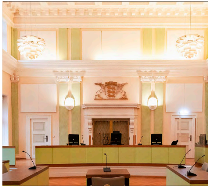
Im Namen des Volkes: Die beiden äußeren Plätze auf der Richterbank sind einer Schöffin und einem Schöffen vorbehalten.

Wer sich für das Schöffenamts wählen lassen möchte, kann sich jetzt bei der Stadtverwaltung melden. Die Bewerbungsfrist endet am Mittwoch, 15. März. Wer das Amt bereits früher ausgeübt hat