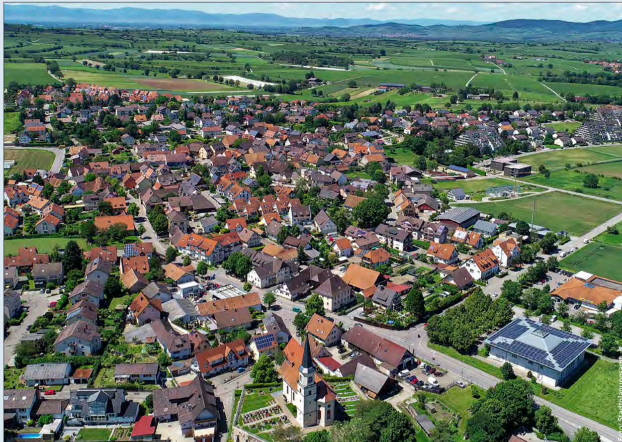
Idyllisch gelegen: Tiengen liegt am Fuße des Tunibergs und ist dennoch gut an Freiburg angebunden.

Der Verlust der Eigenständigkeit war bei der Debatte über die Eingemeindung das große Thema. Die ab 1968 durchgeführte Gebietsreform Baden-Württembergs sollte dazu beitragen, die Leistungs- und Verwaltungskraft der Gemeinden im ländlichen Raum zu stärken. Befürchtet wurde damals vor allem, dass die Verwaltung an Bürgernähe und Selbstständigkeit verlieren könnte. Um diese Sorge zu nehmen, führte das Land die Möglichkeit zur Bildung von Ortschaftsräten ein. Die Tiengener Wahlberechtigten überzeugte das: Mit einer großen Mehrheit von knapp 72 Prozent stimmten sie 1972 für den Zusammenschluss mit Freiburg, und