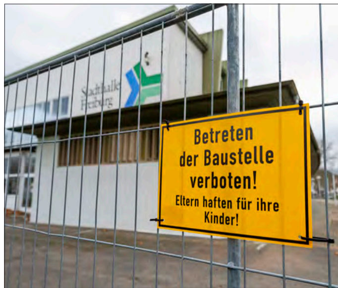
Marode Statik: Um die Stadthalle steht es nicht gut.

Dieser Linie schloss sich der OB an: „Wir distanzieren uns von der Gewalt, aber die Brücke zur Zivilgesellschaft wollen wir nicht abreißen lassen.“ ☛