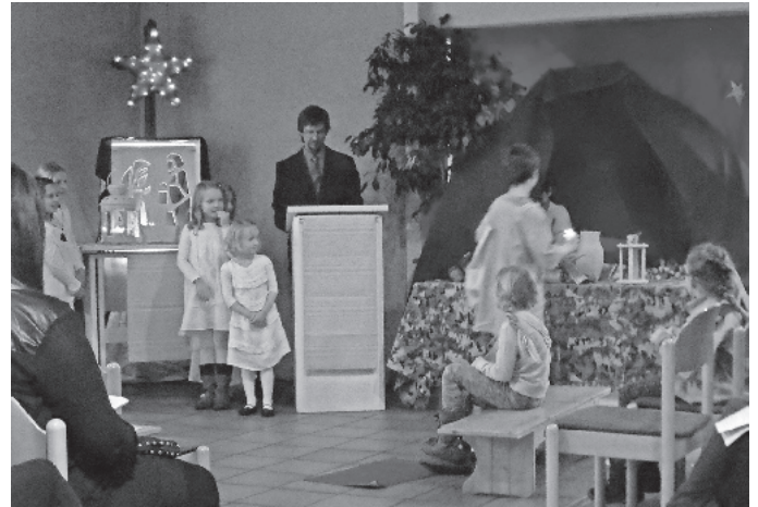
Krippenspiel in Hochdorf (Foto: Joost Wejwer)

Allen Mitwirkenden an diesen Gottesdiensten auf diesem Wege nochmals ein herzliches Dankeschön dafür, dass wir in unserer relativ kleinen Gemeinde in Hochdorf in doch so vielfältiger und besonderer Weise Heilig Abend, Weihnachten und Neujahr feiern konnten.