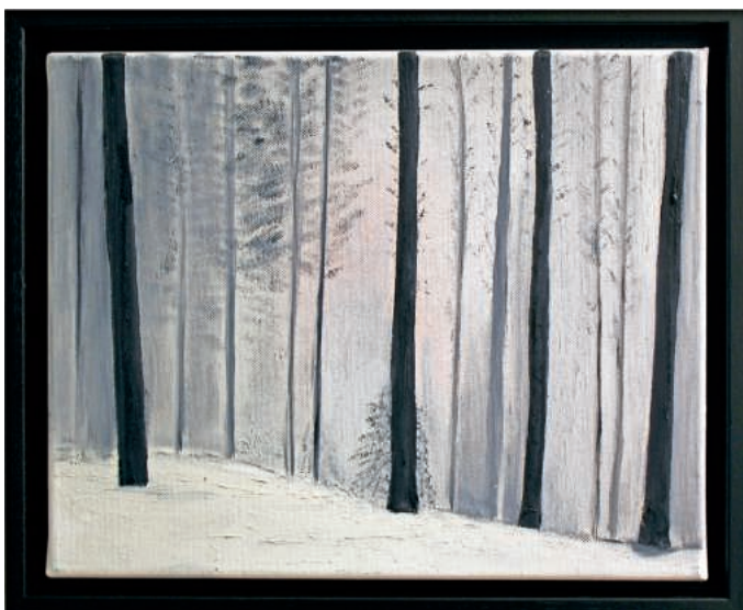
Neue Bilderausstellung im Rathaus von Peter Ludwig