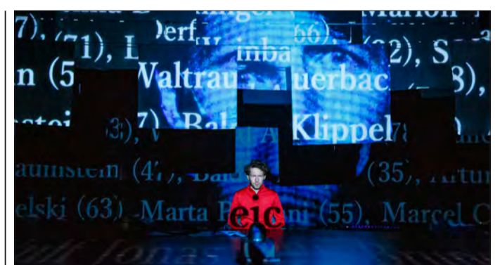
Düstere Stimmung: In „Die Seuche“ bedroht eine mysteriöse Krankheit eine Stadt.

Eine abgeschottete Stadt, ein heimtückisches Fieber, Tausende Tote: Eine mysteriöse Krankheit bedroht die Gesellschaft und das Leben, wie wir es kennen – bis vor Kurzem unvorstellbar. Allerdings hat diese dystopische Vorstellung schon immer eine besondere Faszination ausgeübt. So etwa auf Albert Camus, der schon