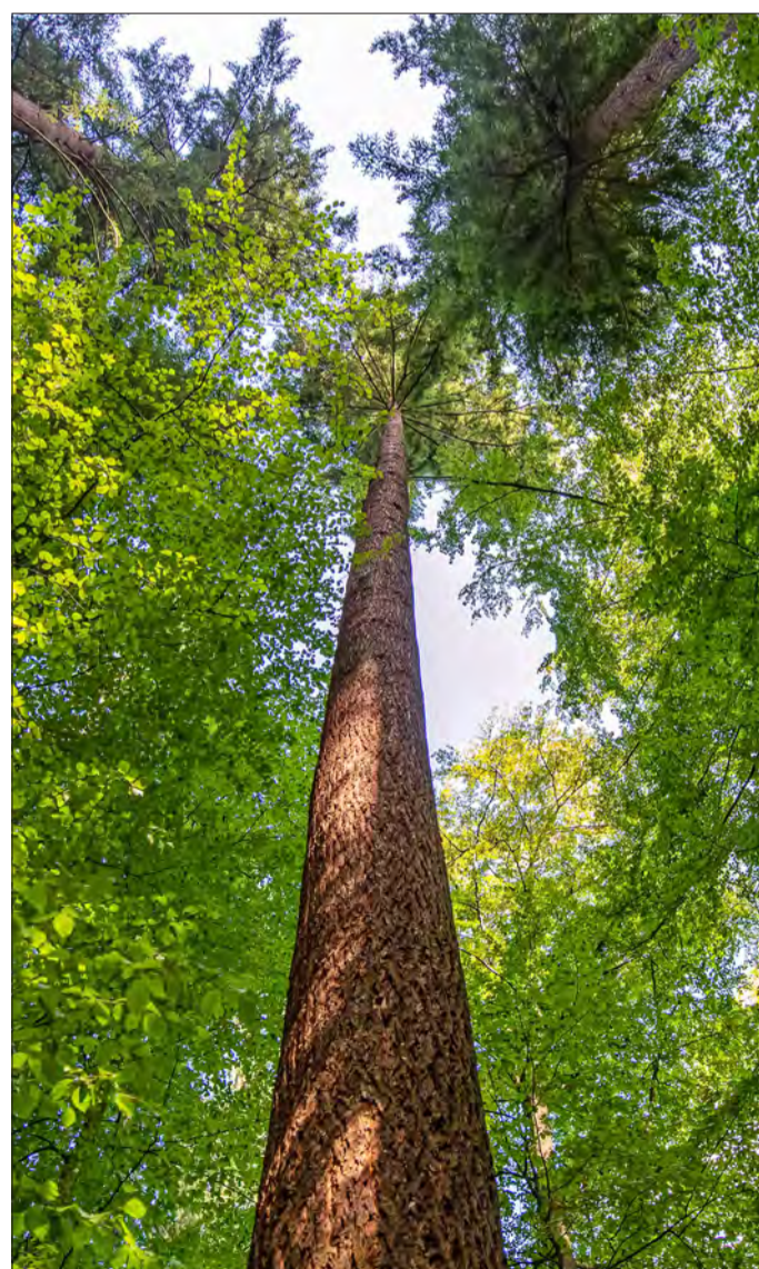
Klingt sperrig, ist aber zukunftsweisend: „Forsteinrichtung“ heißt der Zehnjahresplan, mit dem Freiburgs Stadtwald auf eine trockenere und wärmere Zukunft vorbereitet werden soll.

Die Planungen für das kommende Jahrzehnt zielen darauf ab, den Strukturreichtum, die Diversität und die Stabilität des Stadtwaldes auch in Zeiten des Klimawandels weiter zu erhöhen. Ein Sechstel seiner Gesamtfläche (830 Hektar) dient in besonderem Maße dem