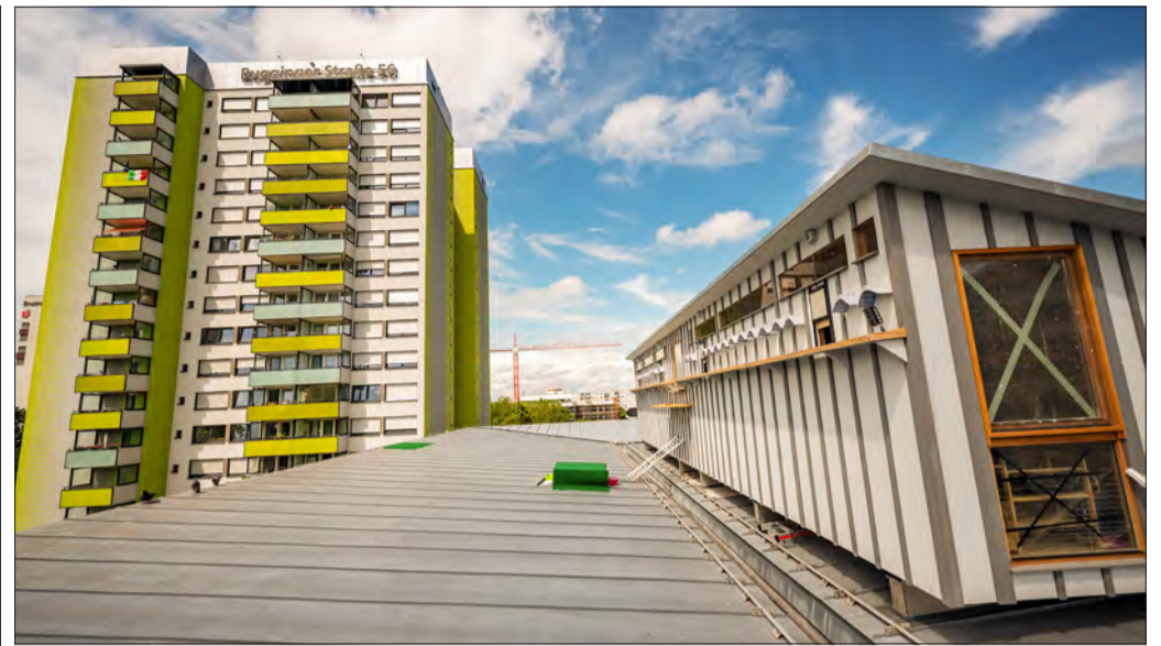
Neue Heimat: Die Tauben der Bugginger Straße leben jetzt nicht mehr auf den umliegenden Balkonen, sondern in ihrem schicken Haus auf dem Dach der Nummer 54. Die Tiere sind standorttreu, aber scheu – bei Pressetermin ließen sie den Menschen den Vortritt.

Dass ihre Eier gegen Gipsattrappen ausgetauscht werden, ist ein weiterer wichtiger Bestandteil des Konzepts, denn