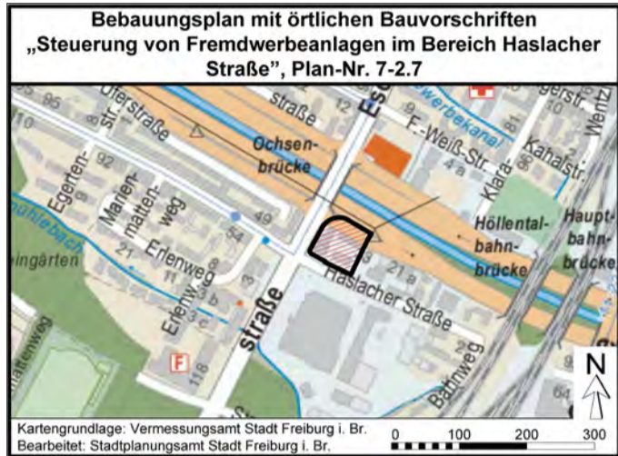
Kartengrundlage: Vermessungsamt Stadt Freiburg i. Br. Bearbeitet: Stadtplanungsamt Stadt Freiburg i. Br.

Die Lage des Plangebiets ist aus dem abgedruckten Stadtplanauszug ersichtlich.