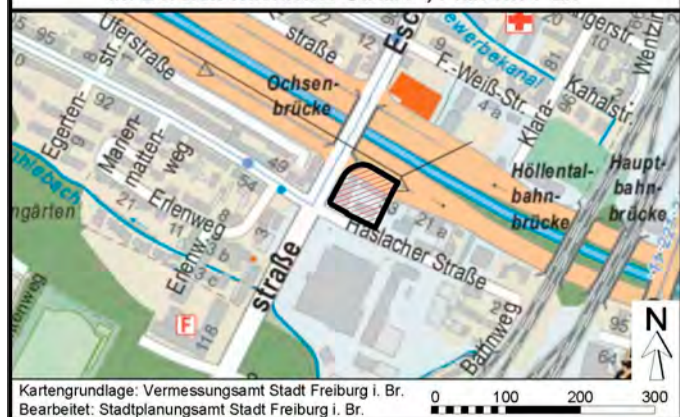
Kartengrundlage: Vermessungsamt Stadt Freiburg i. Br. Bearbeitet: Stadtplanungsamt Stadt Freiburg i. Br.