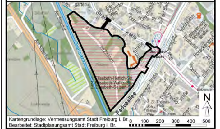
Kartengrundlage: Vermessungsamt Stadt Freiburg i. Br. Bearbeitet: Stadtplanungsamt Stadt Freiburg i. Br.

Aufgrund der Einschränkungen durch die Corona-Pandemie erfolgt die Bekanntmachung gemäß § 2 Abs. 1 Planungssicherstellungsgesetz (PlanSiG) auf der Homepage der Stadt Freiburg. Zusätzlich erfolgt die Bekanntmachung nach § 2 Abs. 1 S. 2 PlanSiG hiermit im Amtsblatt.