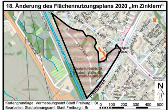
Kartengrundlage: Vermessungsamt Stadt Freiburg i. Br. Bearbeitet: Stadtplanungsamt Stadt Freiburg i. Br.

Die Lage des Plangebiets ist aus dem abgedruckten Stadtplanauszug ersichtlich.