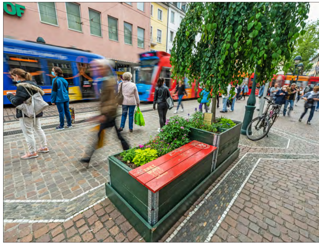
Mehr Herzschlagbänke: Zusätzliche begrünte Sitzbänke sind Teil des von der FWTM vorgelegten Konzepts, das Freiburgs Innenstadt wieder attraktiver machen soll.

Gemeinderat votiert für Konzept zur Wiederbelebung