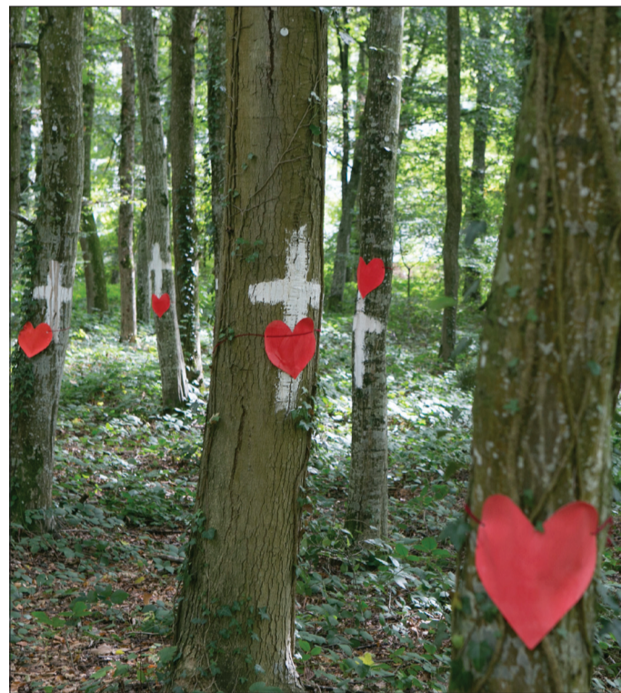
Ein Herz für Bäume: Am Keidelbad soll einer neuer Parkplatz entstehen, für den 190 Bäume gefällt werden müssten. Dagegen gibt es Proteste, und auch im Gemeinderat formiert sich Widerstand. OB Horn stoppt die Planungen und ordnet eine erneute Prüfung möglicher Alternativen an.