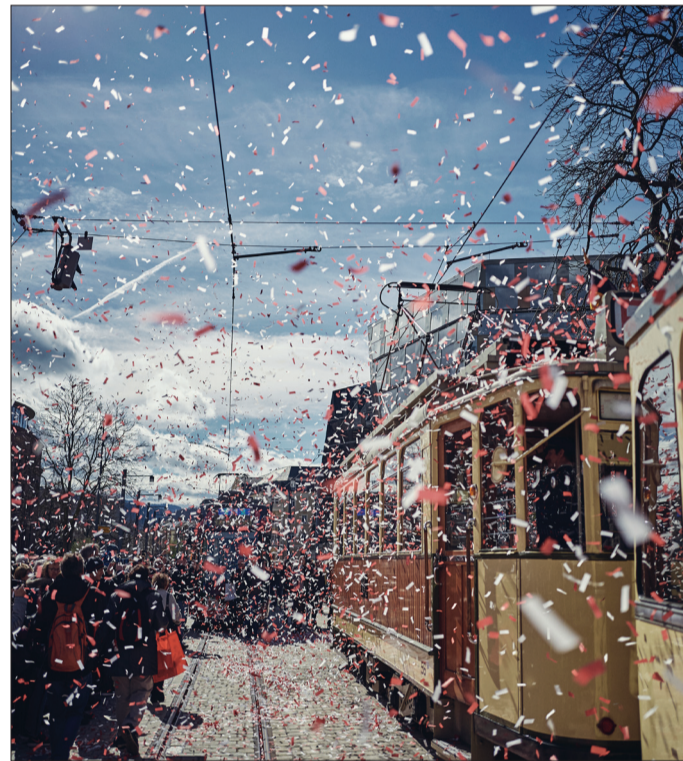
Kaiserwetter und Konfettiregen: Zur Eröffnung der Stadtbahn Rotteckring gibt es bei bestem Wetter ein großes Fest, zu dem Tausende Menschen in die Innenstadt kommen. Zeitgleich startet die VAG den neuen Fahrplan, der für einige Linien neue Routen mit sich bringt.

Wohnen für Hilfe: Bislang hat das Studierendenwerk Wohnpartnerschaften zwischen älteren Menschen mit Unterstützungsbedarf und Studis vermittelt. Jetzt steigt die Stadt mit ein und weitet das Angebot für alle Bevölkerungsgruppen aus.