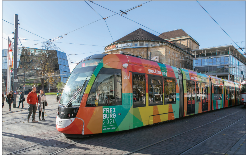
Jetzt wird's bunt: Das Stadtjubiläum 2020 ist nicht mehr zu übersehen. Der Prolog im Augustinermuseum läuft bereits – und diese Straßenbahn versieht als rollende Botschafterin ihren Dienst.