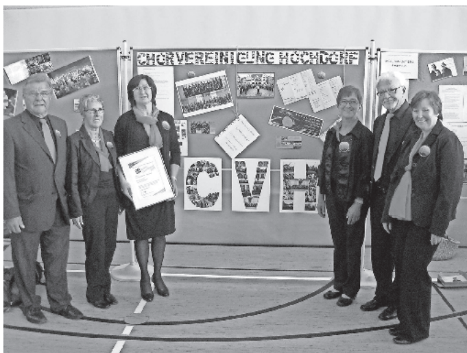
Vor unserer Stellwand

Aller guten Dinge sind Drei - beim dritten Anlauf haben wir es tatsächlich geschafft, die Chorvereinigung Hochdorf zählt in diesem Jahr zu den Gewinnern der Badischen Chorprämie 2014. Von 54 eingereichten Projekten wurden in einer Jury-Sitzung 12 Gewinner ausgewählt, die mit ihren außergewöhnlichen und innovativen Ideen den Chorgesang fördern.