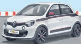
RENAULT TWINGO HIGHLIGHT SCE 70 ECO 2