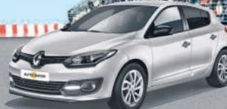
RENAULT MÉGANE HIGHLIGHT 1.6 16V 110

INKL: ÜBERFÜHRUNG UND BEREITSTELLUNG * 0,00 % eff. Jahreszins • Inkl. 5 Jahren Garantie