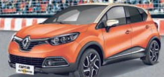
RENAULT CAPTUR ENERGY HIGHLIGHT TCe 90 Start&Stop

INKL: ÜBERFÜHRUNG UND BEREITSTELLUNG * 0,00 % eff. Jahreszins • Inkl. 5 Jahren Garantie