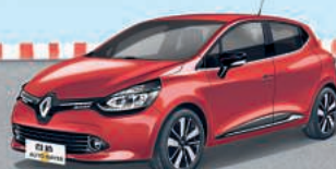
RENAULT CLIO HIGHLIGHT 1.2 16V 65

INKL: ÜBERFÜHRUNG UND BEREITSTELLUNG * 0,00 % eff. Jahreszins • Inkl. 5 Jahren Garantie