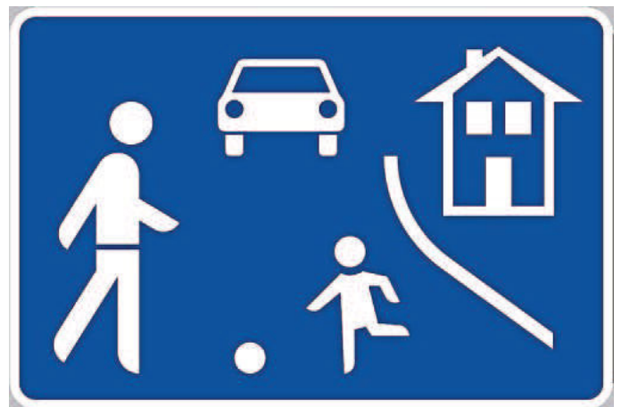
Das Verkehrszeichen 325, das oft an einer sogenannten Spielstraße steht.

In einem Rundschreiben waren alle Anwohner der Straße über diese Lösung informiert worden. Es gab nur positive Rückmeldungen. Daraufhin stimmte der Ortschaftsrats in seiner Sitzung im Mai der Maßnahme zu. Die Markierungen und die neuen Schilder werden demnächst angebracht.