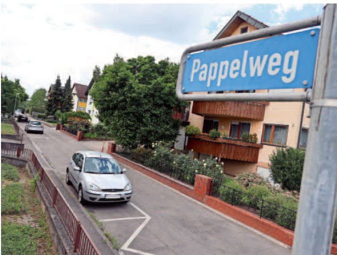
Blick in den Pappelweg

Der hintere Teil des Pappelwegs, die Stichstraße, wird als verkehrsberuhigter Bereich ausgewiesen. Künftig steht am Eingang zu der Sackgasse das bekannte große blaue Schild mit dem ballspielenden Kind und der Silhouette eines Erwachsenen samt den grafischen Zeichen, die ein Haus und ein Auto stilisieren.