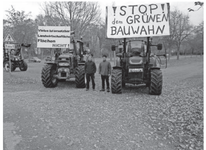
Das Bild zeigt Waltershofener Landwirte bei der Protestaktion.

Am Samstag vor einer Woche fand eine große Protestaktion Freiburger Landwirte mit ihren Traktoren in Freiburg statt. Grund hierfür war der drohende Flächenverlust durch die städtebauliche Entwicklungsmaßnahme Dietenbach. Da durch das geplante Baugebiet auch Waltershofener Landwirte von möglichem Flächenverlust betroffen sein werden, ist auch unsere Landwirtschaft an der Protestaktion beteiligt gewesen.