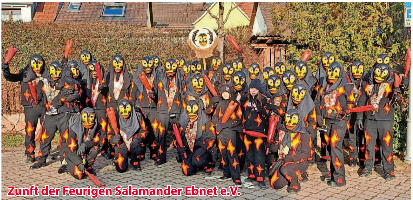
Zunft der Feurigen Salamander Ebnet e.V.