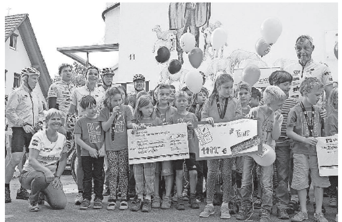
Das Foto zeigt Verantwortliche, Radler und Schüler bei der Scheckübergabe vor der Hofackerschule.

Der Einsatz bei der Tour Ginkgo von 30. Juni bis 2. Juli hat sich gelohnt. Die Radfahrer/innen haben für den Bau zeitgemäßer Familienwohnungen in der Familien-Rehabilitationsklinik Katharinenhöhe 207.000 Euro eingesammelt, wovon nahezu 2.000 Euro in Waltershofen eingesammelt worden sind. Viele Spendenaktionen sind noch angekündigt, stehen aber noch aus, sodass sich die Gesamtsumme noch erhöhen wird. Bis Ende des Jahres sammelt die Christiane-Eichenhofer-Stiftung über ihre Hauptveranstaltung Tour Ginkgo hinaus noch Spenden für die Katharinenhöhe.