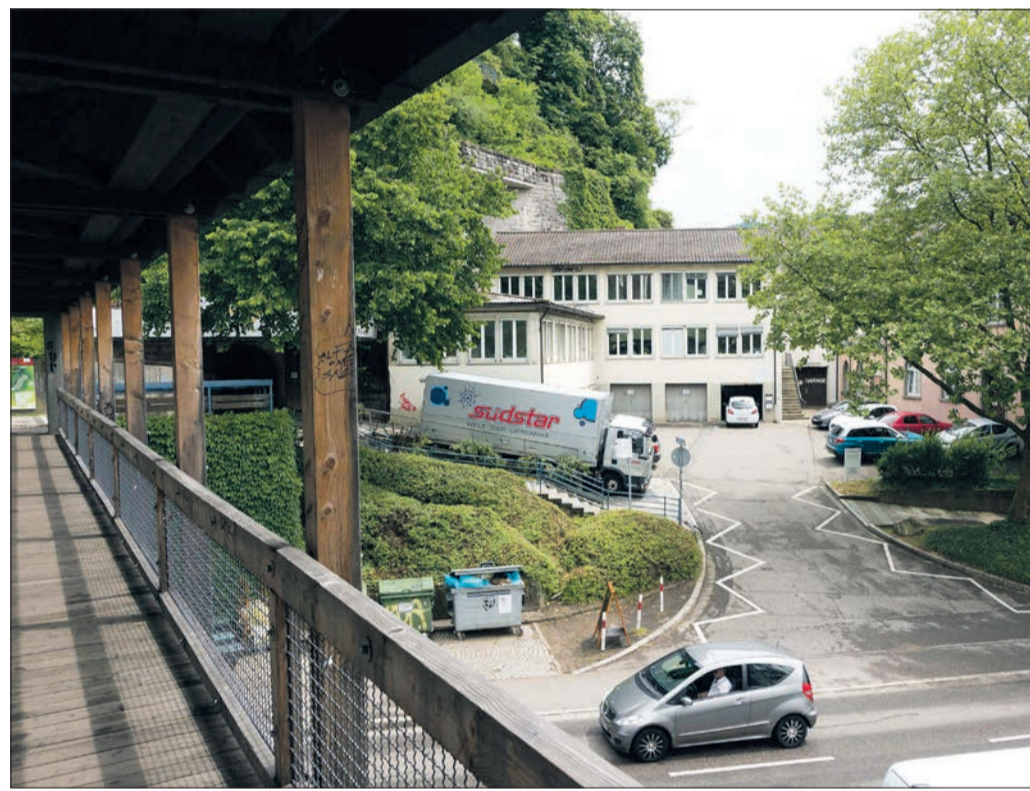
Obdach für Frauen: In den bald frei werdenden Gebäudekomplex am Schlossbergring kommt für fünf Jahre eine Unterkunft für wohnungslose Frauen.

Die städtischen Einrichtungen, die derzeit noch das Anwesen nutzen, ziehen ins neue Verwaltungszentrum um. Nach Umbauten erhalten dann 18 wohnungslose Frauen am Schlossbergring 1 vorübergehend eine gute, sichere Unterkunft in Wohngruppen. Ihre soziale Betreuung übernimmt