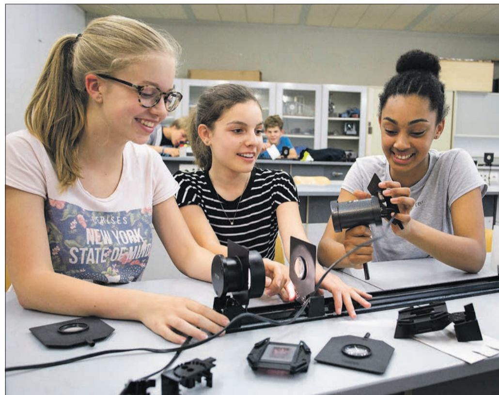
Mit Durchblick: Auch wenn der Physikaal nicht ganz „up to date“ ist, haben diese Schülerinnen im Deutsch-Französischen Gymnasium Spaß an optischen Experimenten.

Die Chemiesäle wiederum sehen so aus wie wahrscheinlich in jeder Schule, die aus den 1970er- oder 1980er-Jahren stammt. An der Decke zeu-