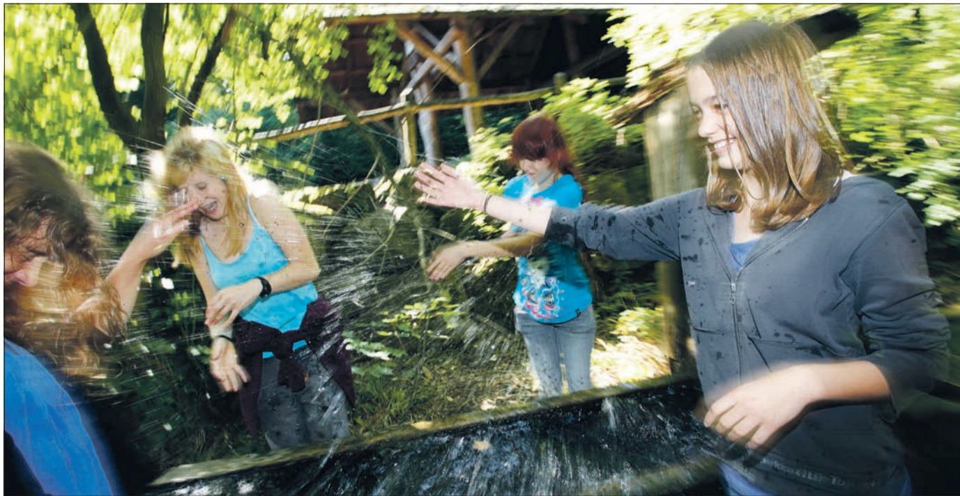
Auf zum Wasserfest: Im Waldhaus Freiburg kommen weder Spaß noch Bildung zu kurz.

Höhepunkt des Wasserjahres ist ein großes Fest, das am Sonntag, dem 25. Juni, im und am Waldhaus stattfinden wird. Zwischen 11 Uhr am Morgen bis etwa 18 Uhr am Abend gibt es ein unterhaltsames und lehrreiches Angebot für Kinder und Erwachsene. Der Eintritt zu allen Veranstaltungen ist frei, aber Spenden sind willkommen. Unterstützt wird das Wasserfest durch Infostände zahlreicher Initiativen und Verbände: Brasilieninitiative, Indienhilfe – Wasser ist Leben, Terre des Hommes, Eine Welt Forum Freiburg, Regiowasser e.V., Günterstaler Wiese e.V., Viva con aqua und dem Wiwili-Verein Freiburg.