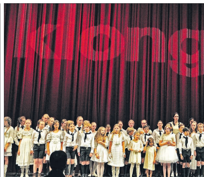
Musik für Groß und Klein: Beim 8. Kindermusikfestival Klong gehört die Bühne vor allem dem Nachwuchs.

Alle Festivalveranstaltungen sind kostenlos. Teilweise sind jedoch Einlasskarten erforderlich, die ab 11.15 Uhr an der Kartenausgabe in der Passage 46 erhältlich sind. Das gesamte Klong-Programm und weitere Informationen gibt es unter www.freiburg.de/klong sowie beim Kulturamt (201-2101, kulturamt@stadt.freiburg.de ). ☛