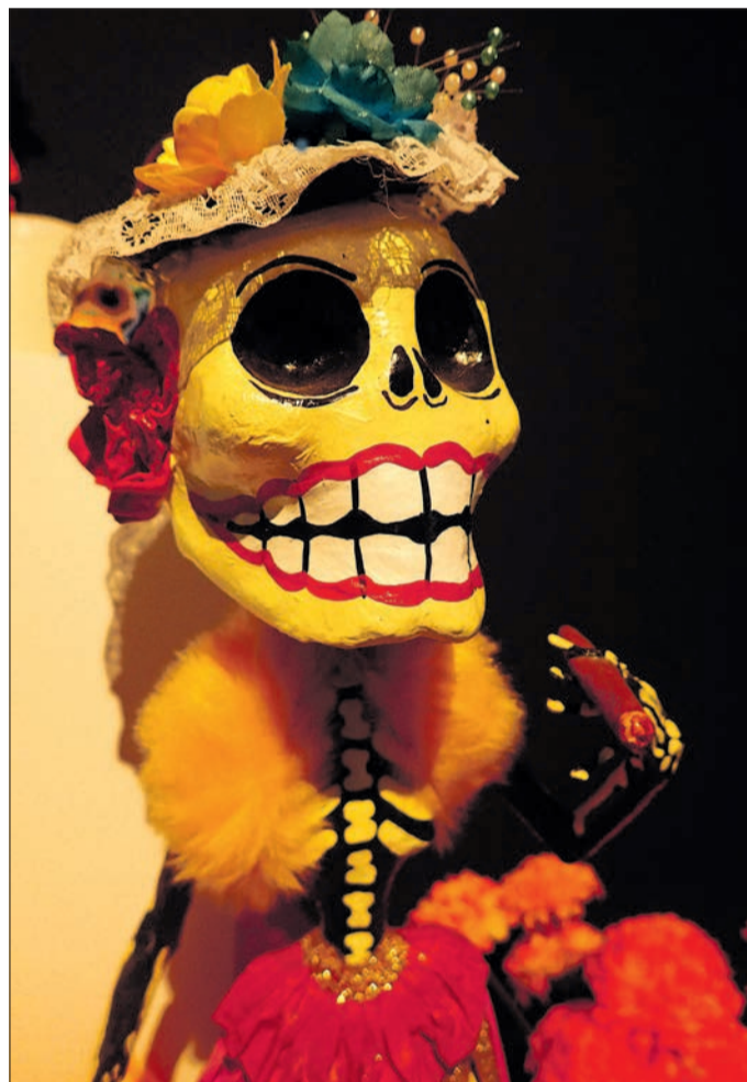
Schöner Tod: Auf dem mexikanischen Gabentisch für Verstorbene ist der Tod (gibt es eine weibliche Form?) fein herausgeputzt und geschminkt.

Öffnungszeiten: Di–So 10–17 Uhr, Eintritt beide Ausstellungen 7/5 Euro. Informationen über das Begleitprogramm unter www.freiburg.de/museen