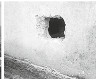
Einbruch in das Gebäude

Spendenkonto: Direkthilfe für Kleinprojekte e.V.