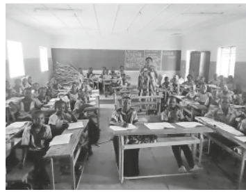
Ein Blick in ein Klassenzimmer

Wo: Vereinsraum der LandFrauen, Dreisamhalle Ebnet im UG, Unteres Grün 15