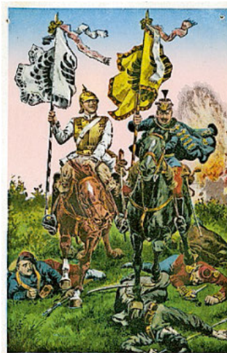
Ich halt' einen Kameraden.

So wurde das Lied vom „guten Kameraden“ im ersten Weltkrieg in vielfältiger Weise missbraucht: