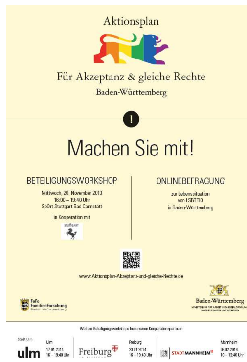
Abbildung 2: Plakat Beteiligungsworkshop

Insgesamt nahmen an den jeweils vierstündigen Beteiligungsworkshops über 600 Personen aus Landes- und Kommunalverwaltungen, Politik und der LSBTTIQ-Community, interessierten Bürger_innen sowie weitere gesellschaftliche Akteur_innen teil. Der Ablauf der Veranstaltungen verlief an allen Standorten analog. Zu Beginn gab es Impulsvorträge von Vertretungen der Landesregierung, dem jeweiligen Oberbürgermeister oder Bürgermeister und dem Netzwerk LSBTTIQ Baden-Württemberg sowie in Mannheim dem Rektor der