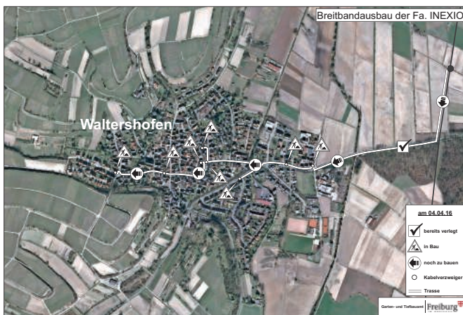
Die Grafik zeigt den Stand des Ausbaus am 04.04.2016.

Der Ausbau der Breitbandverkabelung in Waltersshofen im Auftrag der Firma Inexio ist in vollem Gang. Der Bauzeitenplan kann nach Auskunft der ausführenden Firma eingehalten werden, sodass voraussichtlich ab Juni tatsächlich die höheren Internet-Geschwindigkeiten erreicht werden können.