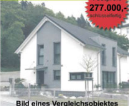
Bild eines Vergleichsobjektes

BREISGAU HAUS GMBH · Ballrechter Straße 11 · 79219 Staufen-Grünern Fon 07633 908849-34 · info@breisgau-haus.de · www.breisgau-haus.de