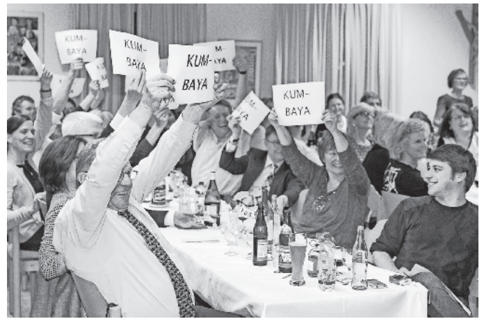
Singen ohne Töne