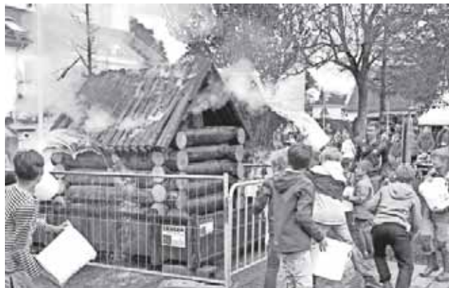
Spaß hatten alle als bei der Aktion „löschen für einen guten Zweck“ selbst angepackt werden durfte.

Die Aktion „löschen für einen guten Zweck“ erbrachte insgesamt rund 300,- €. Die Ebneter Abteilung stockte diesen Betrag auf 550,- € auf und konnte die Summe an den Verein „Ride2live“ übergeben.