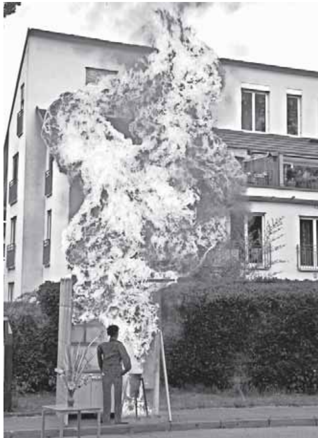
Beindruckend für Groß und Klein die gewaltige Stichflamme die eine Fettexplosion auslösen kann.

zusätzlichen Aktionen zu umrahmen und nicht einfach nur Geburtstag zu feiern. So entstand neben den Vorführungen der Jugendfeuerwehr Kappel-Ebnet und dem von einigen Kameraden der aktiven Wehr begleiteten Küchenbrand auch die Idee einer kleinen Ausstellung historischer Feuerwehrutensilien. Des Weiteren gab es wieder die Möglichkeit für den guten Zweck zu löschen. Wie bereits zur 900-Jahrfeier wurden für einen kleinen Spendenbeitrag Eimer an die Festbesucher ausgegeben, mit denen die Besucher selbst ein „Wohnhausbrand“ löschen durften.