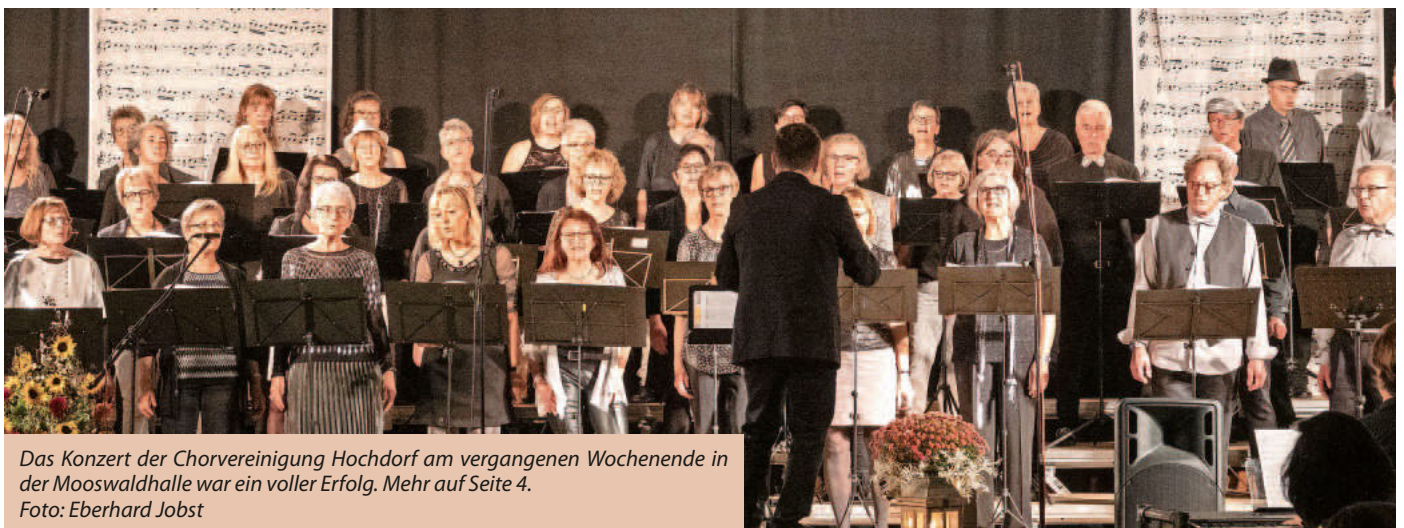
Das Konzert der Chorvereinigung Hochdorf am vergangenen Wochenende in der Mooswaldhalle war ein voller Erfolg. Mehr auf Seite 4.