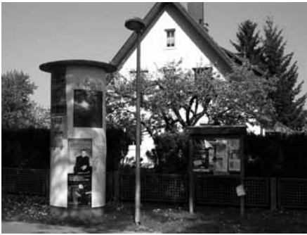
Straßenlaterne in der Bahnhofstraße