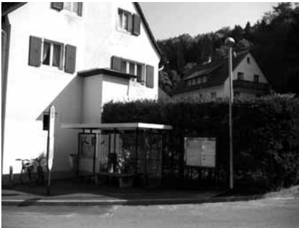
Straßenlaterne an der Bushaltestelle Am Bannwald