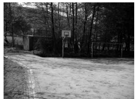
Bolzplatz am Hercherhof