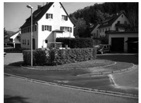
Buswendeschleife Am Bannwald

Die badenova hat je eine zusätzliche Straßenlaterne an der Ecke Bahnhofstraße/Kirchzartener Straße und an der Buswendeschleife „Am Bannwald“ aufgestellt.