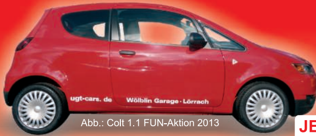
Abb.: Colt 1.1 FUN-Aktion 2013