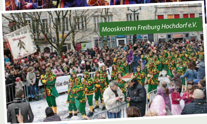
Mooskrotten Freiburg Hochdorf e.V.