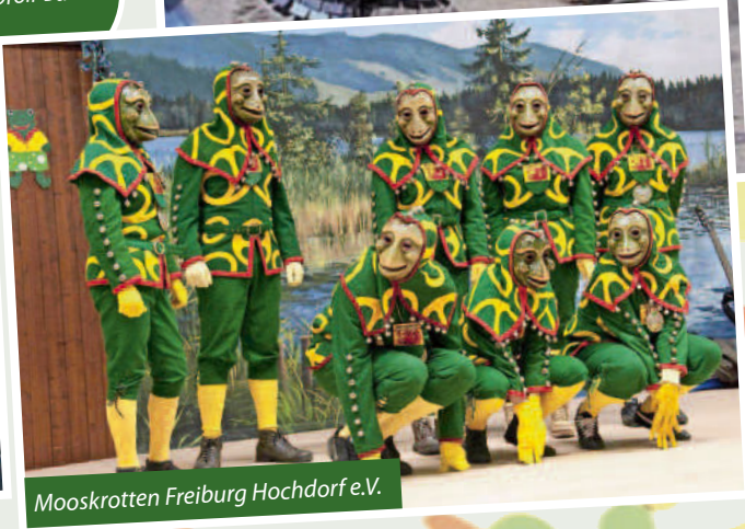
Mooskrotten Freiburg Hochdorf e.V.