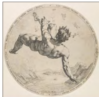
Hendrick Goltzius nach Cornelis Cornelisz, Phaeton, 1588.

Der niederländische Kupferstecher und Maler Hendrick Goltzius (1558–1617) machte sich mit seinen erzählerischen Darstellungen und