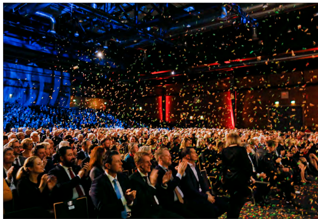
Ein Konfettibad beendete am Schluss Reden und Taneinlagen.

Ich wünsche Ihnen ein gutes, gesundes und erfülltes Jahr 2020. Auf Freiburg! Vielen Dank.