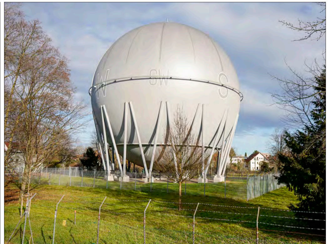
Erhalt gesichert – Zukunft offen: Als Kulturdenkmal ist der Abriss der Gaskugel kein Thema mehr. Eine Verein wünscht sich künftig eine kulturelle Nutzung.

Das lange geplante Baugebiet Obergrün führte ebenfalls zu mehreren Nachfragen. Aktuell, so der OB, stehen noch drei Gutachten aus. Auf deren Basis wird die Verwaltung eine Beschlussvorlage erarbeiten, die mehrere Varianten enthal-