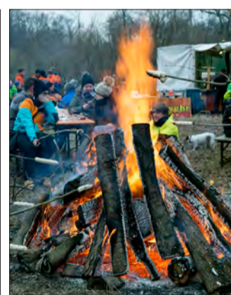
Stockbrot ist noch schöner als die Holzversteigerung...

Unter Leitung des Forstamts und der Ortsverwaltung Opfingen kommen etwa 100 Ster Brennholz unter den Hammer. Die Mindestpreise liegen bei 55 Euro pro Ster für einen Meter langes Scheitholz. Außerdem wird vier bis sieben Meter langes, rundes Brennholz versteigert, das in Stapeln zu sechs bis zehn Ster am Waldweg