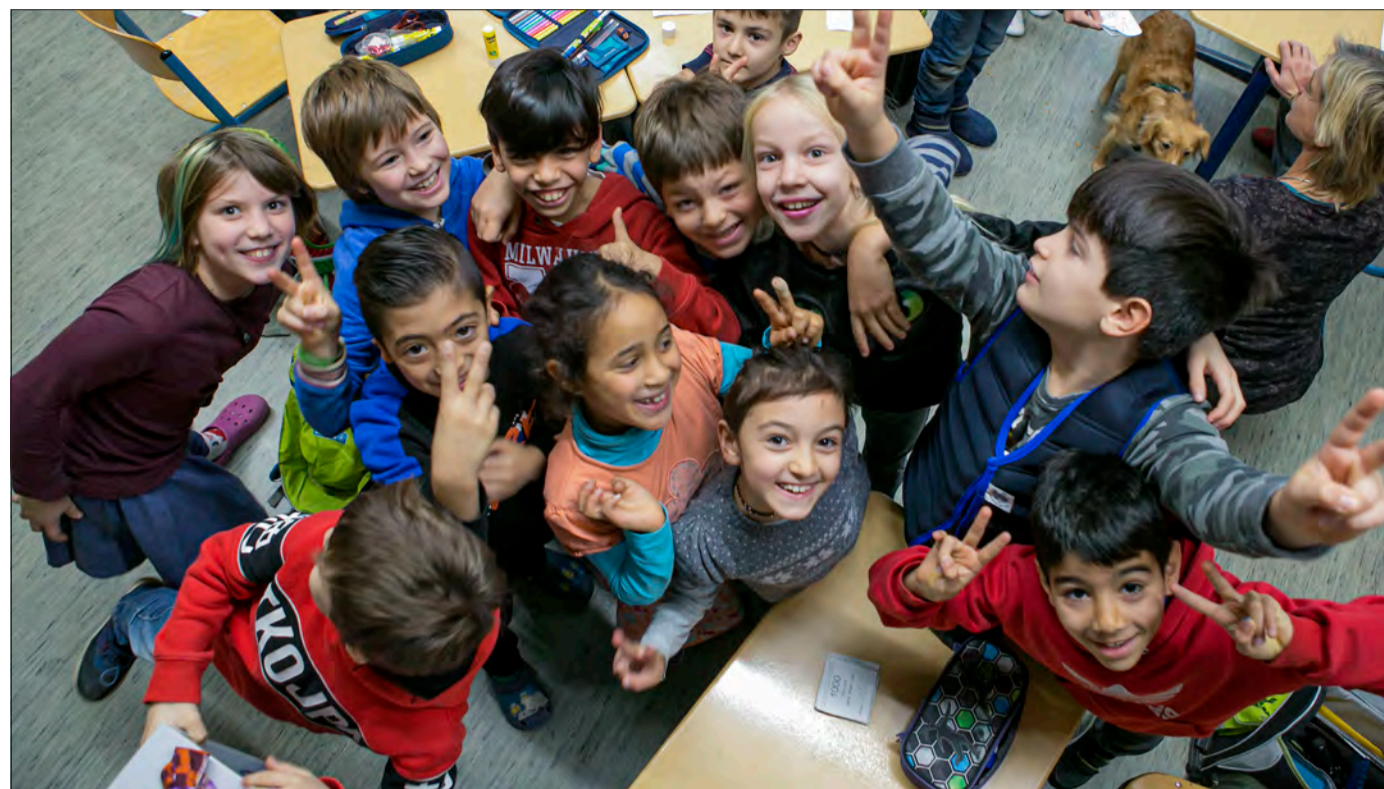
Bunt gemischt: Die Schülerinnen und Schüler der Hebelschule kommen alle aus dem selben Stadtteil, haben ihre Wurzeln aber in vielen verschiedenen Ländern.

Alle Folgen der Serie unter www.freiburg.de/schuleimblick