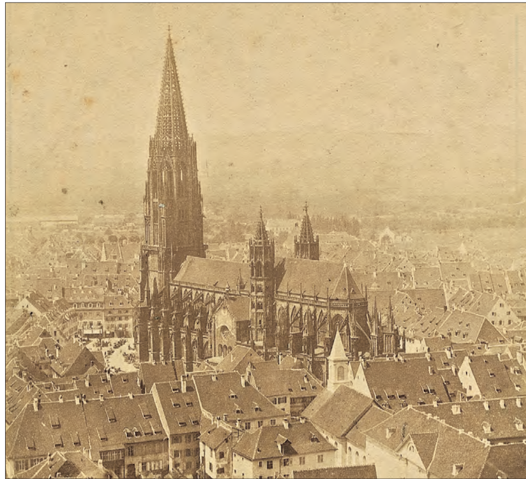
Das erste Foto des Münsters: Zu sehen ist ein zeitgenössisches Werk von Gottlieb Theodor Hase aus dem 19. Jahrhundert. (Foto: G. T. Hase)

spielerischen Neuschöpfungen bereits zu Lebzeiten einen Namen. Anders als viele Zeitgenossen war das Allroundtalent gleichzeitig als Entwerfer, Stecher und Verleger tätig. Seine römischen Helden, Göttinnen und Himmelsstürmer huldigen dem menschlichen Körper und strahlen große Dynamik aus. 31.10.2020 bis 31.1.2021