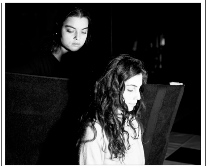
Bedrückende Stimmung: Eine dunkle Kulisse soll das Thema angemessen untermalen.

Auf einer interaktiven Bühne verschwimmen Illusion und Realität durch komplexe Erzählstrukturen aus persönlichen Texten, Bewegung, Musik, Video und Technologie. Die Schauspielerinnen und Schauspieler nehmen das Publikum auf eine bedrückende