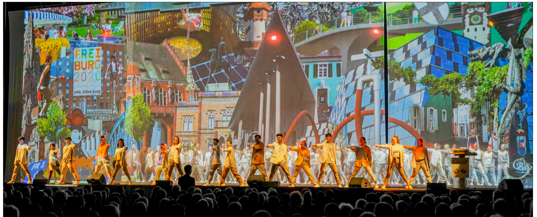
Panoptikum der Stadtgeschichte: Rund 120 Tänzerinnen und Tänzer, darunter viele Ehrenamtliche im Alter zwischen 8 und 74 Jahren hat das Aktionstheater Panoptikum auf die Bühne gebracht.

Nationalisten und Populisten haben darauf eine einfache wie falsche Antwort: So wie früher. Dabei wird ein „Früher“ suggeriert, dass es nie gegeben hat. In der Vergangenheit war nicht alles besser. Die Vergangenheit zeigt, dass die Ablehnung alles Fremden die Demokratie zerstört. Ein Blick zurück lehrt uns, dass ein aggressiver Nationalismus im Krieg endet. Das dürfen wir nie vergessen. Gerade in