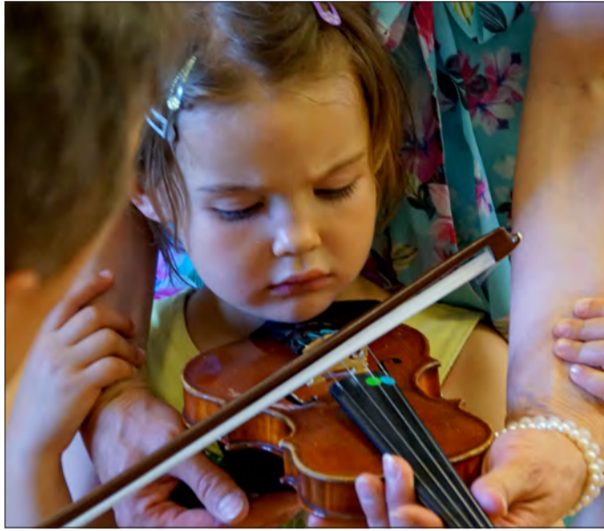
Fleißig am Üben: Dem musikalischen Nachwuchs wird die Geige gezeigt.

Sollte das Dargebotene Anklang finden, können sich Interessierte bis zum 1. April online unter www.musikschule-freiburg.de für den Unterrichtsbeginn im April (zweites Musikhalbjahr) anmelden oder sich telefonisch unter 8885 1280 erkundigen. ☘