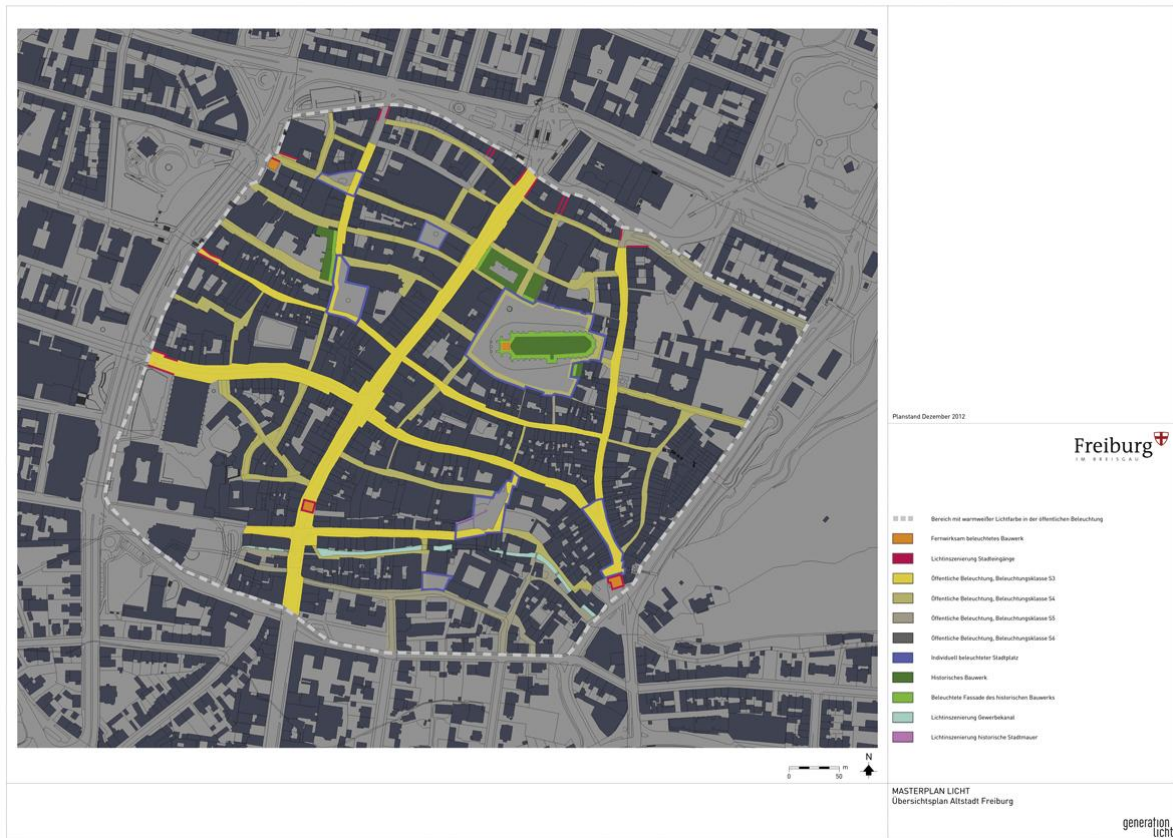
Grafik: Auszug aus dem Masterplan für die Freiburger Innenstadt.