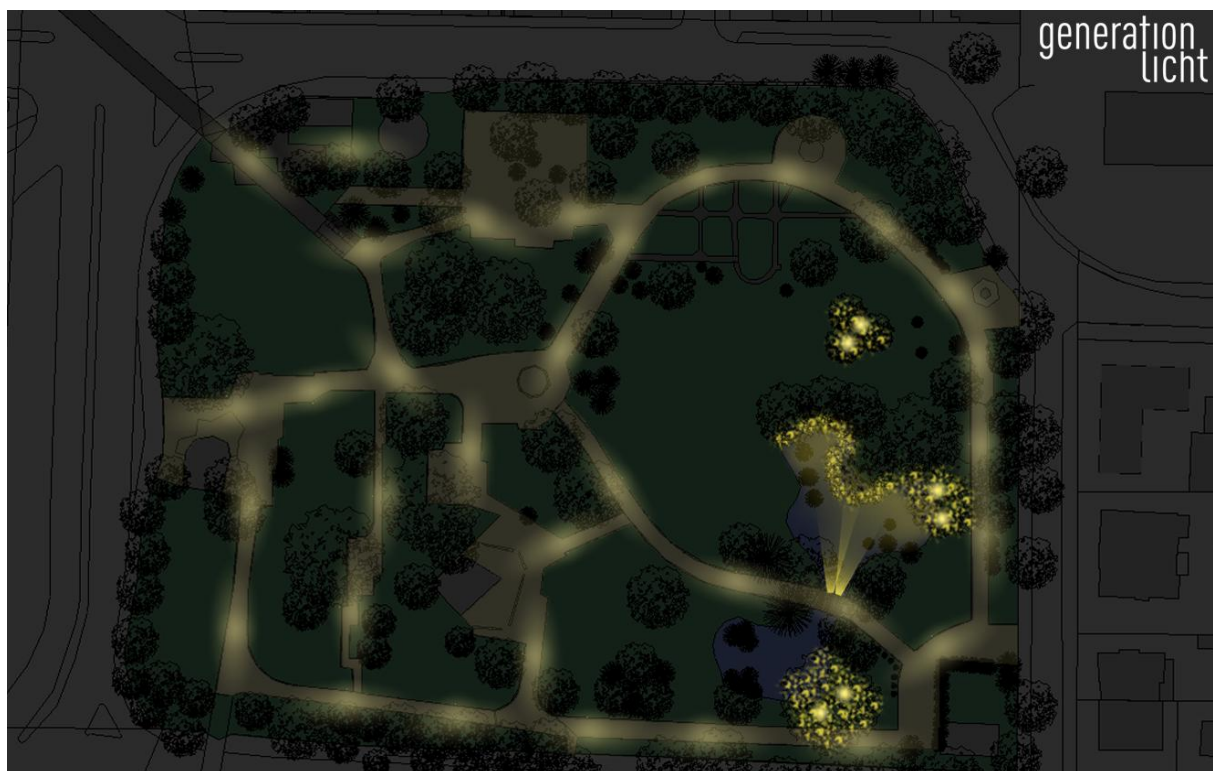
Grafik: Lichtplanung und Visualisierung der geplanten Leuchtenstandorte für die Wegebeleuchtung im Stadtpark